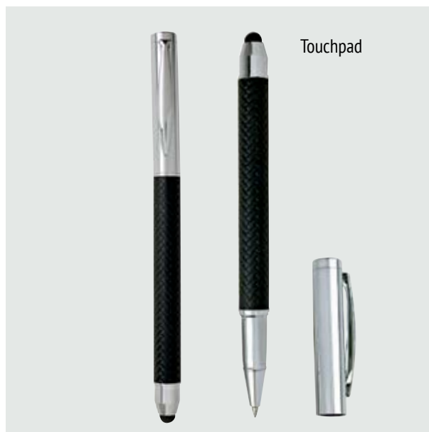
BOL 520 Bolígrafo Bernini