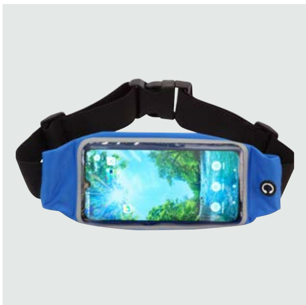
MAL 219 Sport Bag