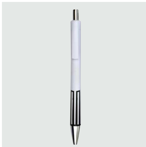
BOL 23 Bolígrafo Chagall