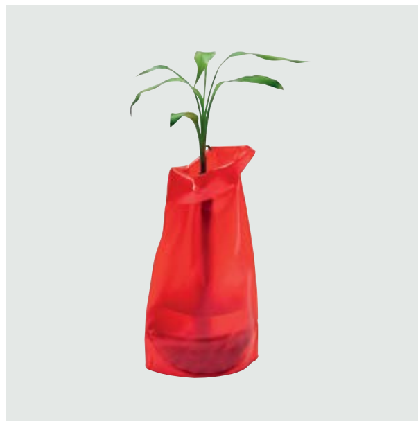
CAS 18 Florero Grande Foldable