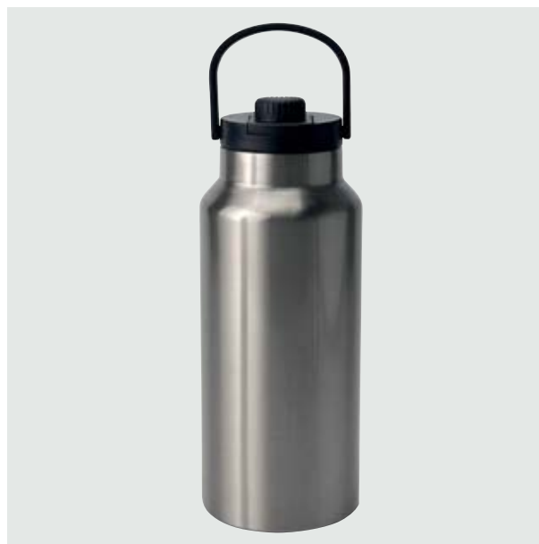
TH 28 Termo Abedul