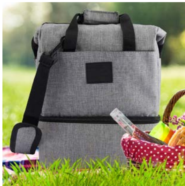
MAL 112 Lonchera Brady