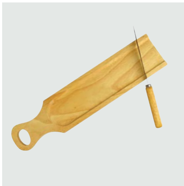
CAS 56 Set Cuchillo