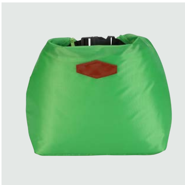
MAL 101 Lonchera Markova ■ ■ ■ ■

Material: Polyester Medida: 27 x 22.5 cm.