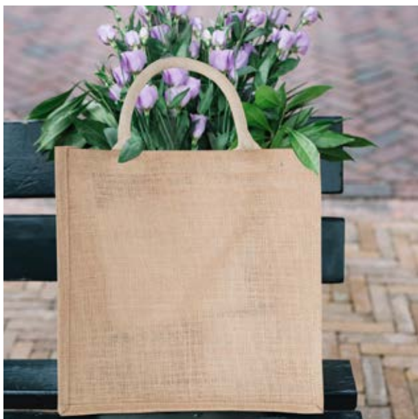
MAL 10 Bio Hand-Bag