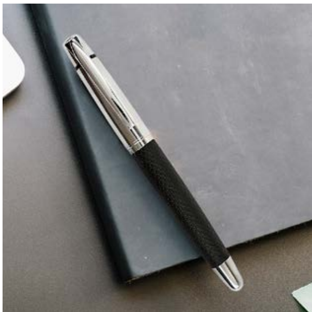
BOL 522 Bolígrafo Turner