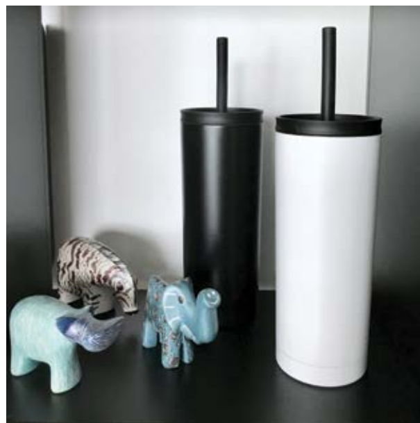
TH 09 Termo Aloe