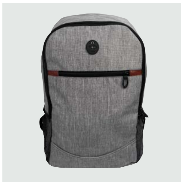
MAL 214 Backpack Dulko