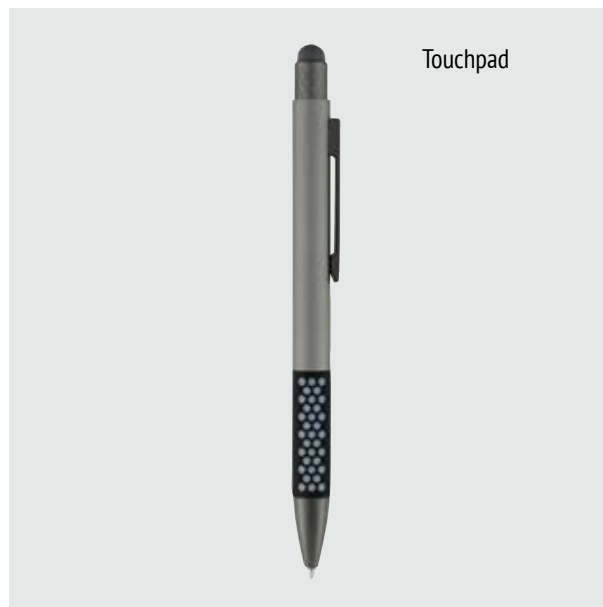
BOL 517 Bolígrafo Lloyd