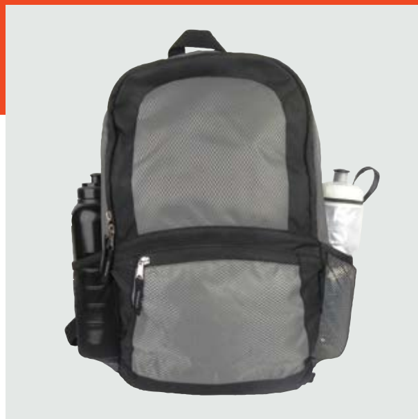
MAL 617 Backpack Lance ■