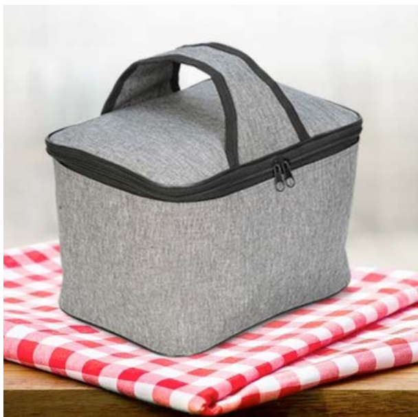
MAL 114 Lonchera Milton