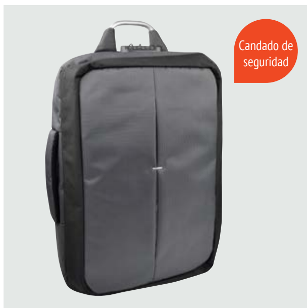
MAL 612 Backpack Tiger