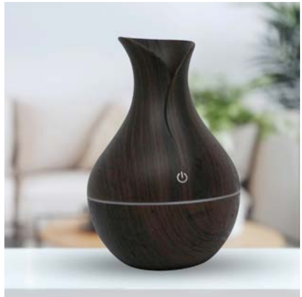
CAS 01 Vaporizador Contempo