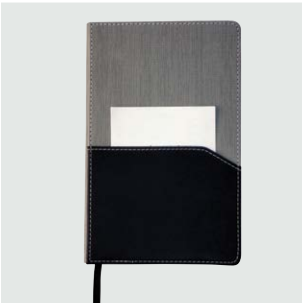
ESC 527 Libreta Dakota