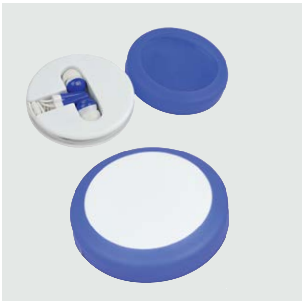
TEC 02 Earbuds Kepler