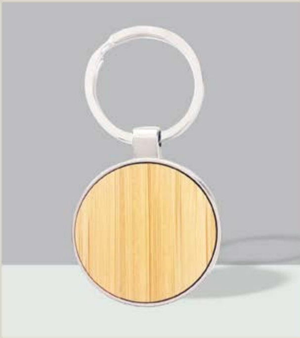
LLA 44 Llaverito Redondo Bamboo