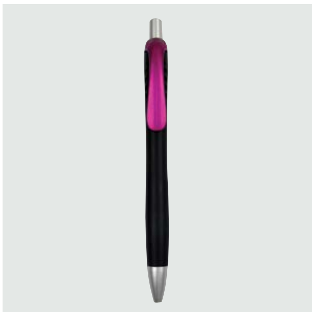
BOL 10 Bolígrafo Keita