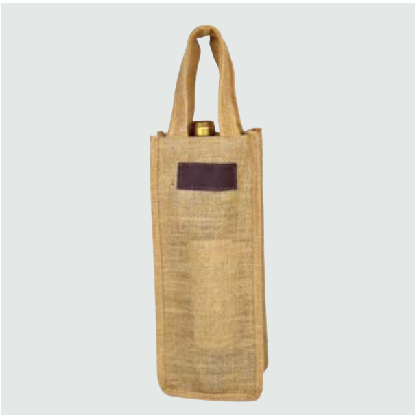
CAS 34 Portavinos Yute