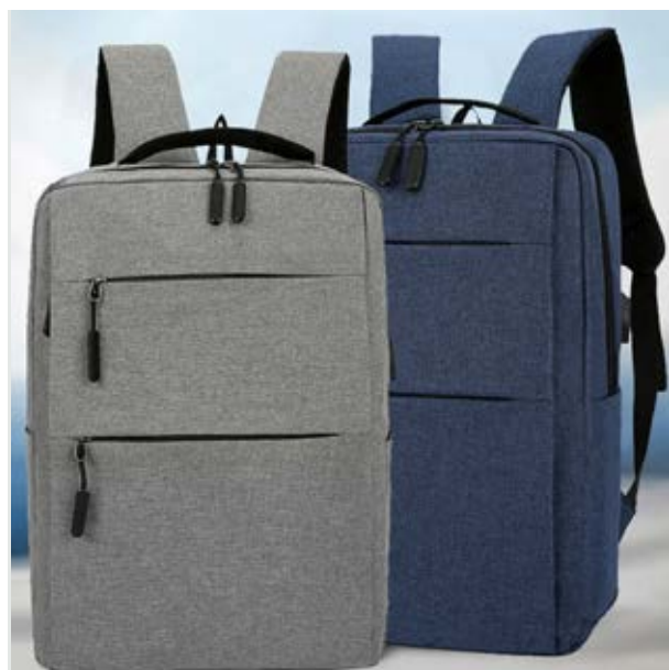
MAL 611 Backpack Duncan ■ ■