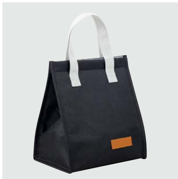
MAL 105 Picnic Bag