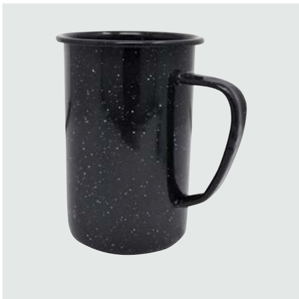
TH 213 Tarro Cervecero