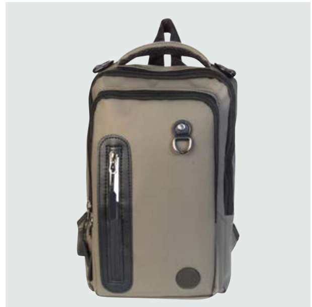
MAL 211 Backpack Baylor