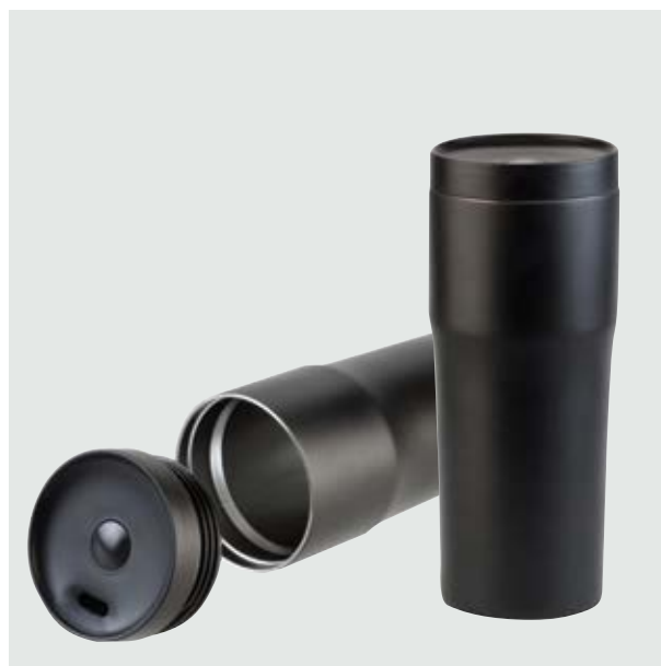
TH 03 Termo Yuca