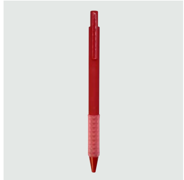
BOL 07 Bolígrafo Homer