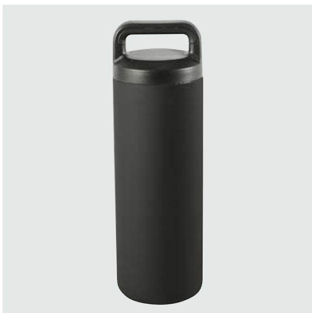
TH 18 Termo Rudo ■