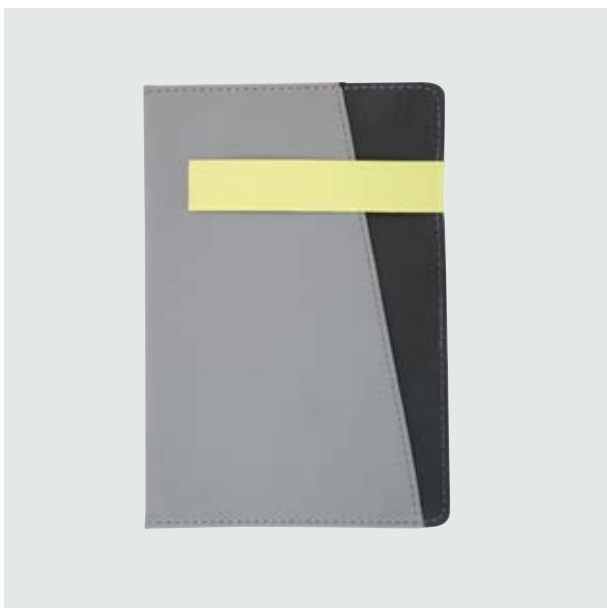
ESC 531 Libreta Moskú