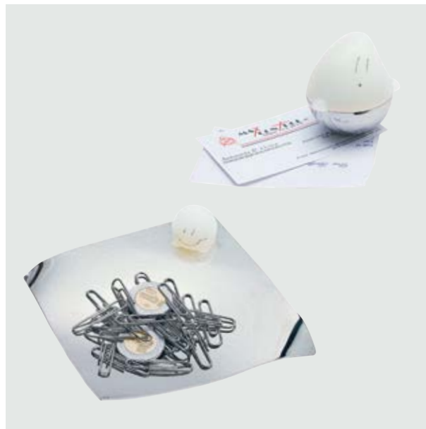
ESC 590 Set Fantasma