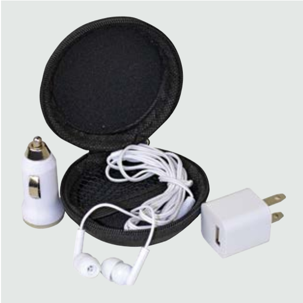
TEC 101 Kit Faraday