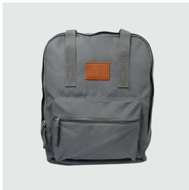
MAL 212 Backpack Karpov