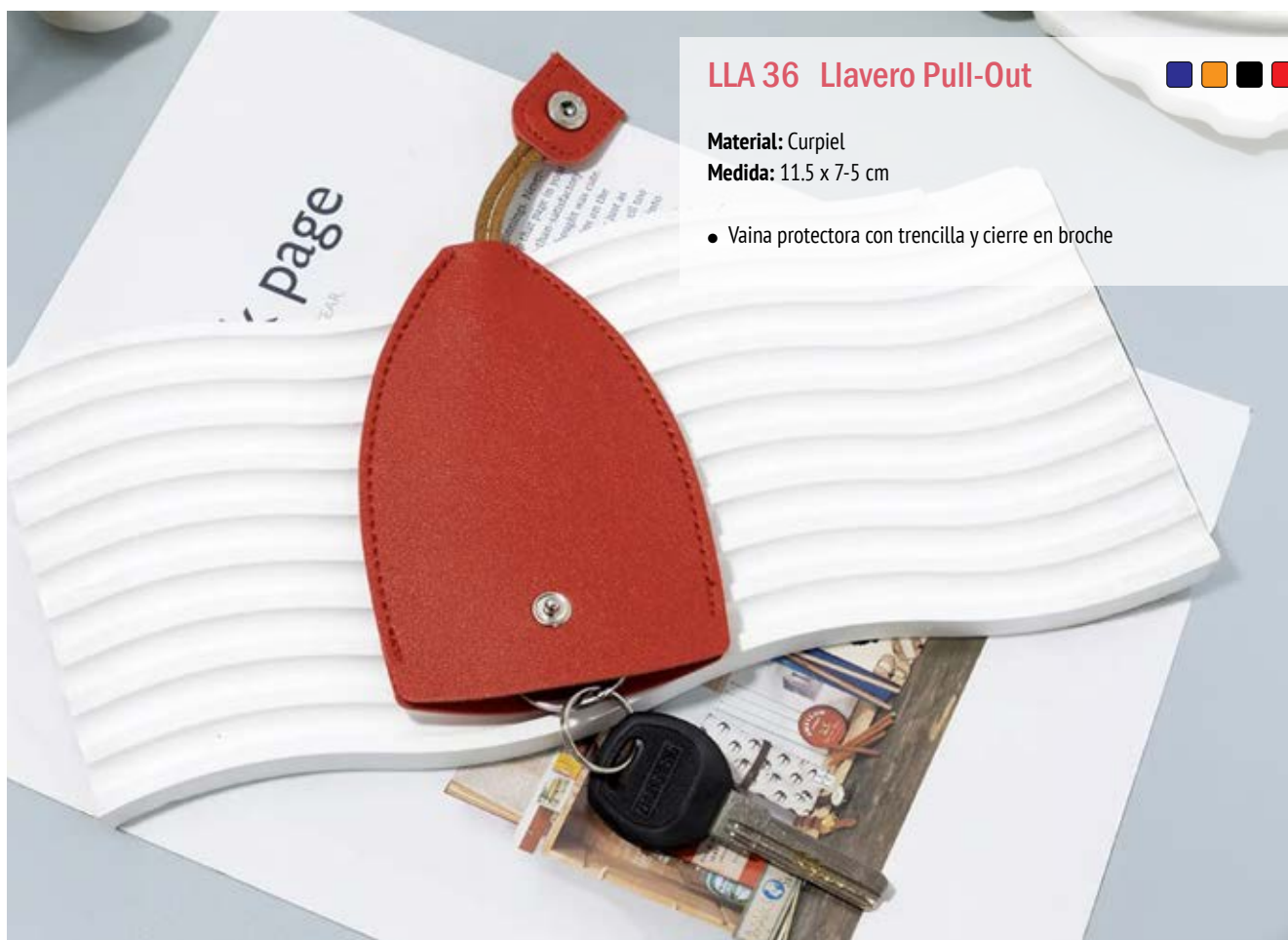
LLA 36 Llavero Pull-Out

Material: Metal y Curpiel Medida: 12.1 x 2.2 cm.