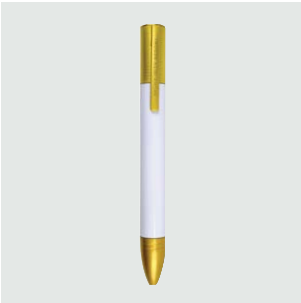
BOL 574 Bolígrafo Doré