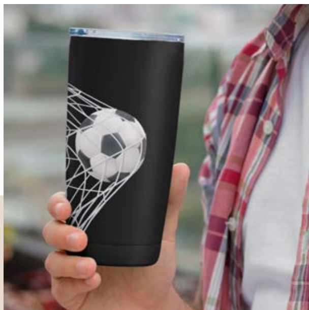
TH 07 Termo Vitex