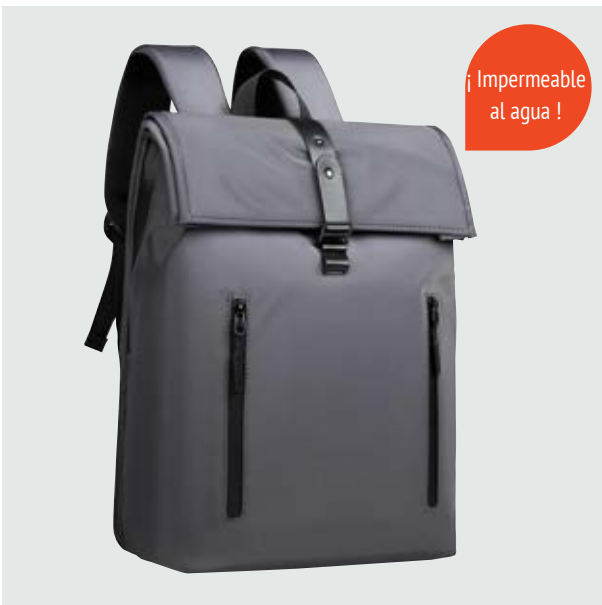
MAL 606 Backpack Iniesta