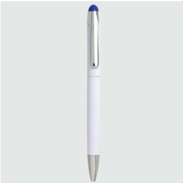
BOL 09 Bolígrafo Luke