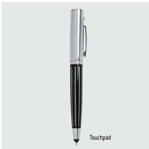
BOL 525 Bolígrafo Firenze