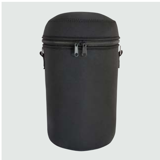
MAL 109 Lonchera Halep

Material: Neopreno Medida: 24 x 16 cm diámetro