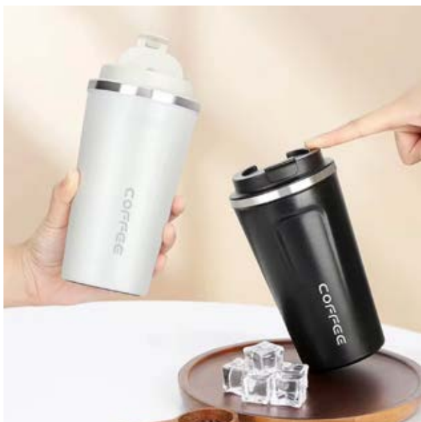
TH 08 Termo Alcatraz