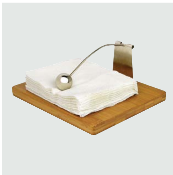
CAS 60 Servilletero Wiki