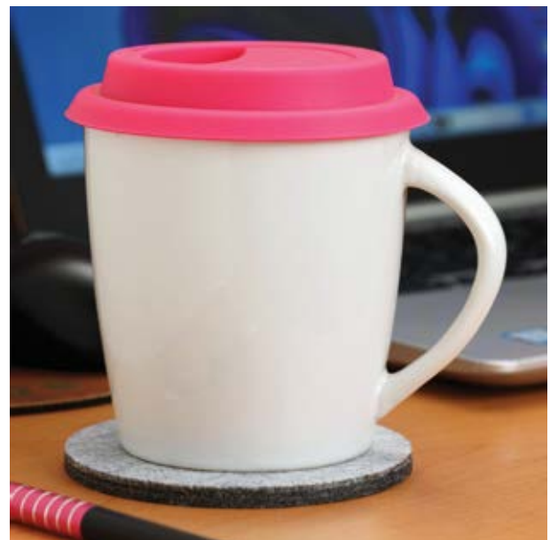
TH 204 Tazón Volca