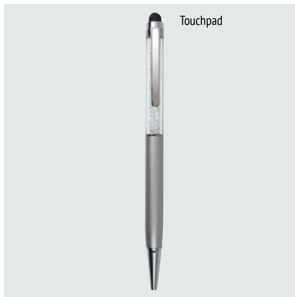
BOL 550 Bolígrafo Crystal