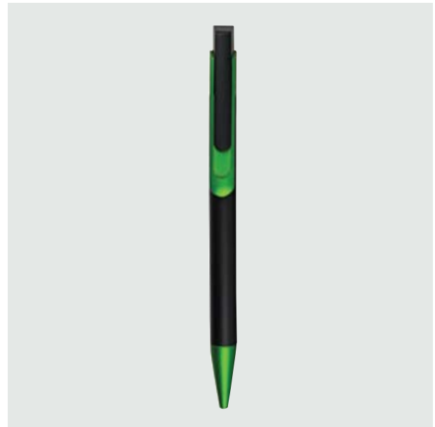
BOL 107 Bolígrafo Tintoretto