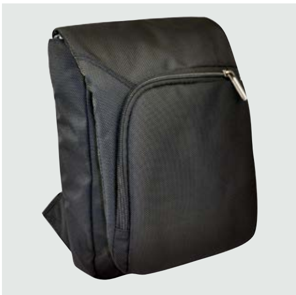
MAL 525 Crossbody Robinson ■