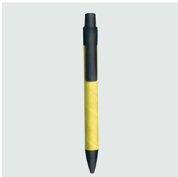
BOL 332 Bolígrafo Gorda Eco

Material: Cartón y plástico Medida: 13.8 x 1 cm.