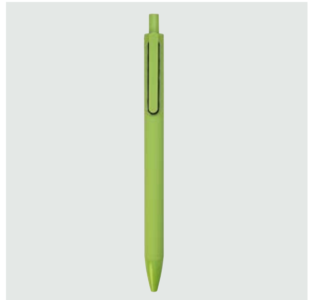
BOL 14 Bolígrafo Angélico