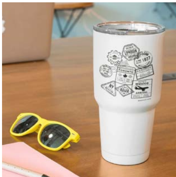
TH 06 Termo Pomelo