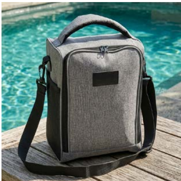
MAL 108 Lonchera Lombardi