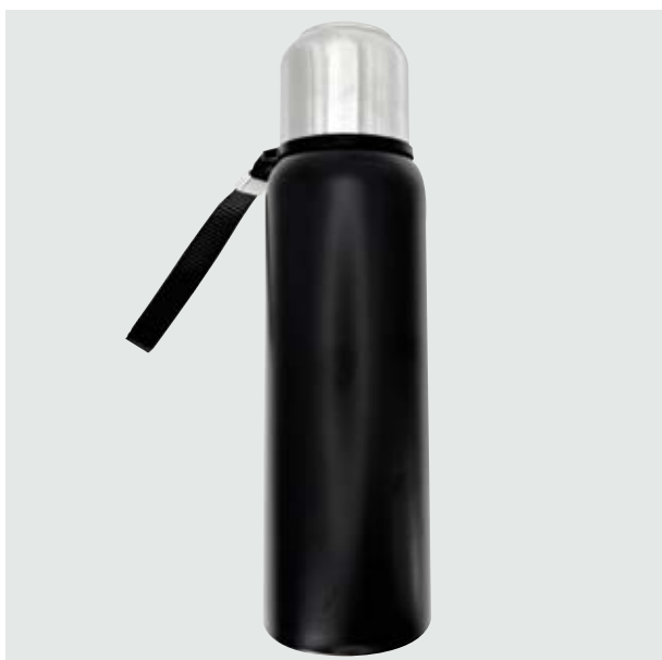
TH 29 Termo Nogal