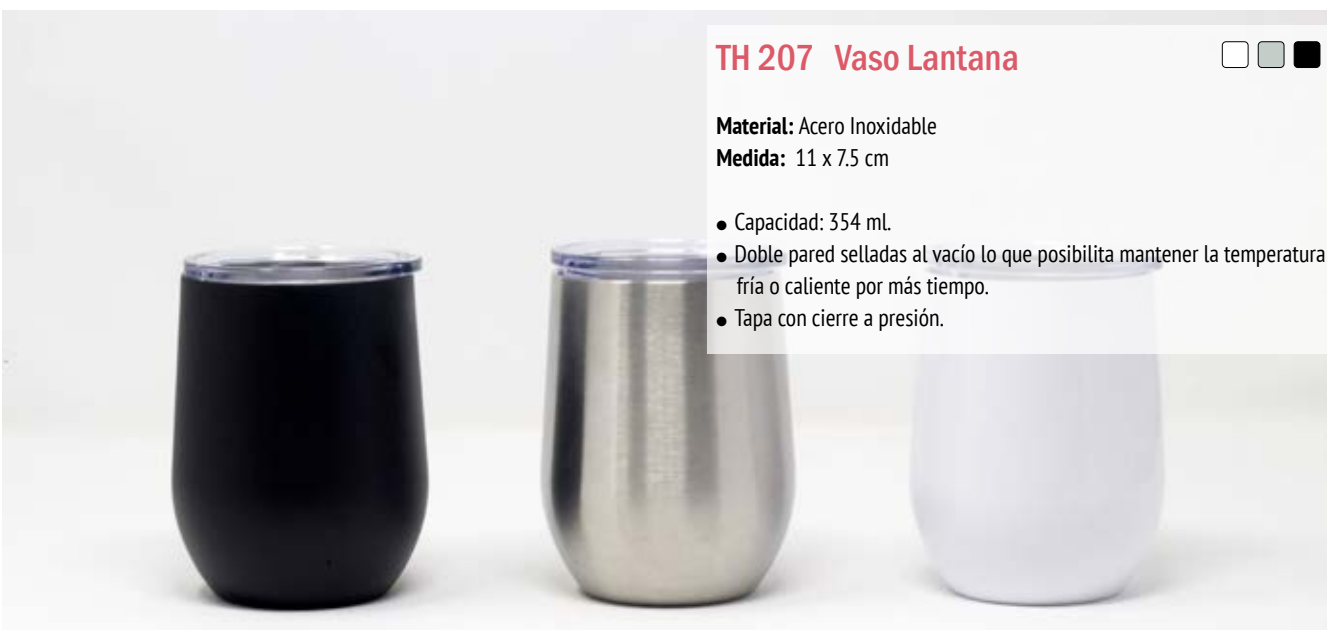
TH 207 Vaso Lantana