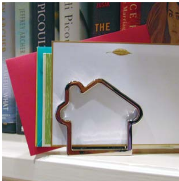
ESC 860 Porta Tarjetero Niza