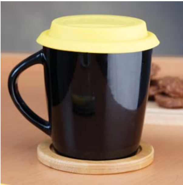
TH 204 Tazón Volca