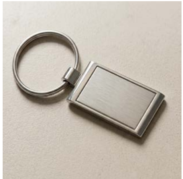
LLA 22 Llavero Rectangular Sencillo Plano