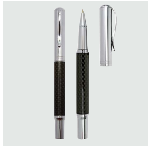
BOL 552 Bolígrafo Mónaco