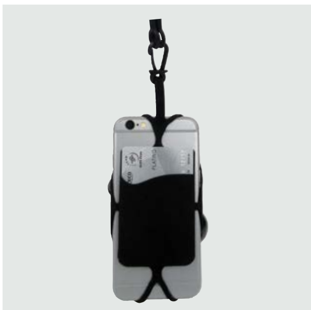
TEC 264 Porta-Celular Kelvin