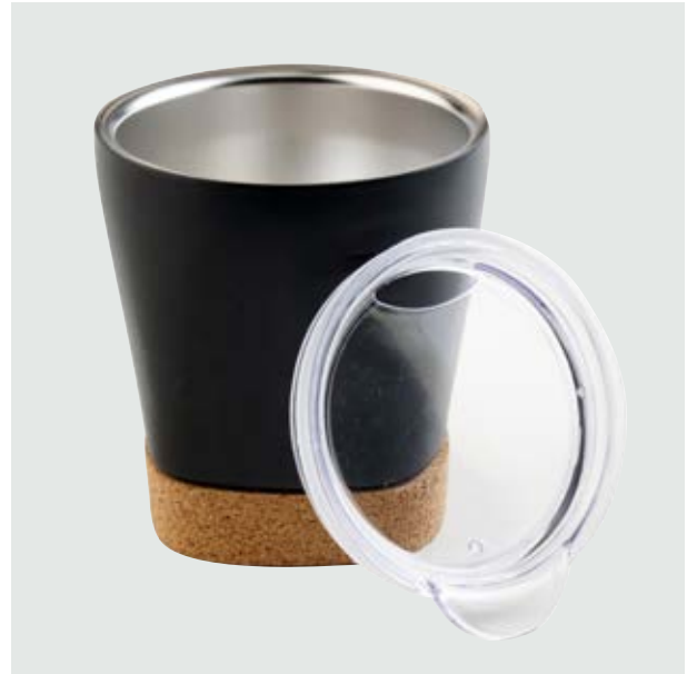
TH 203 Vaso Alpino