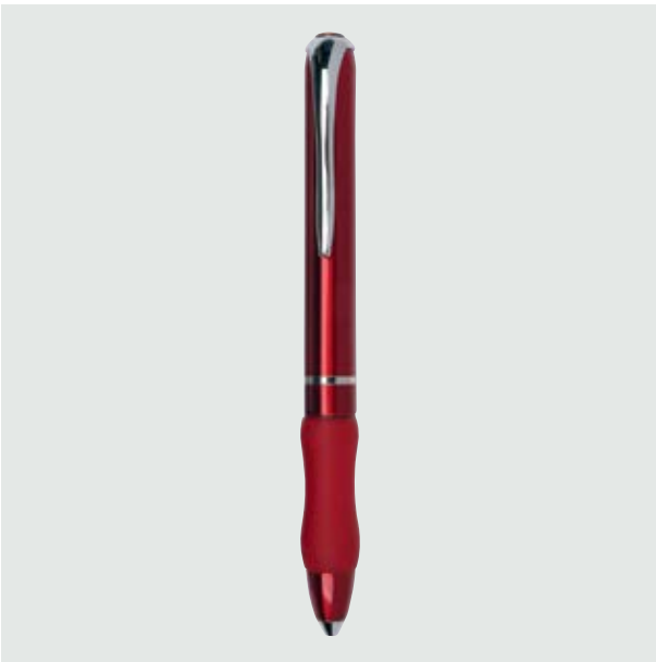
BOL 558 Bolígrafo Monet