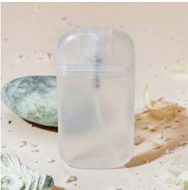
SAL 05 Oxy Sanitizer