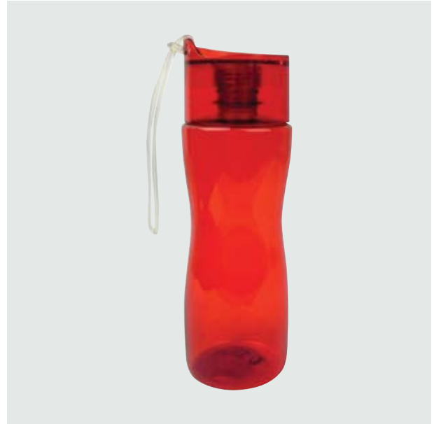
TH 113 Cilindro Junior Color