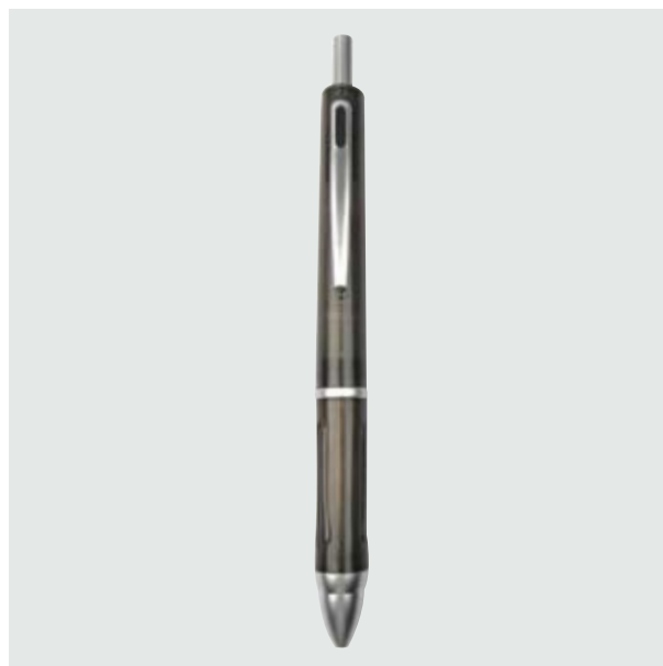
BOL 11 4-1 Bolígrafo Traslúcido