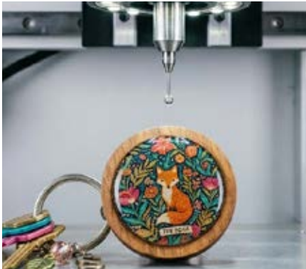
Gota de Resina

Lo anterior da como resultado una personalización impresa o grabada de nuestros productos con alta calidad garantizada.