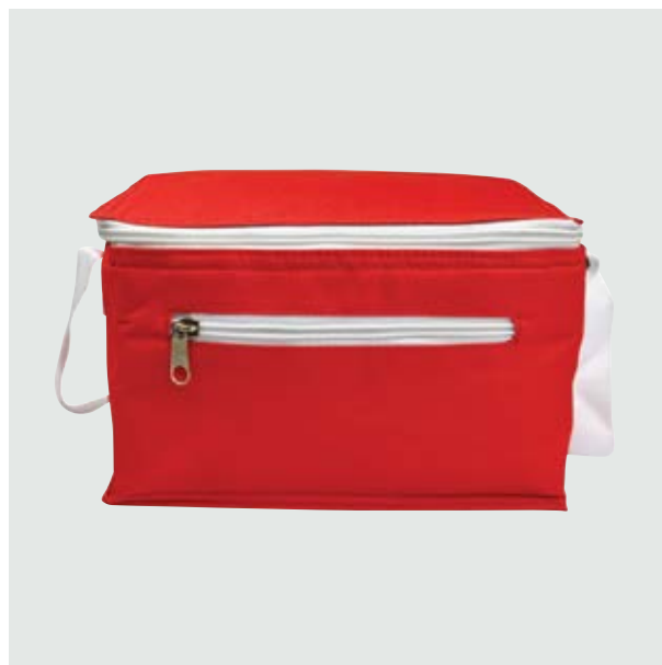
MAL 107 Lonchera Williams ■ ■ ■ ■ ■

Material: Polyester Medida: 21.3 x 14 x 12.5 cm.