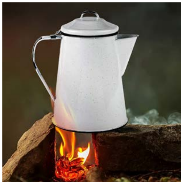
TH 51 Jarrilla Alamo