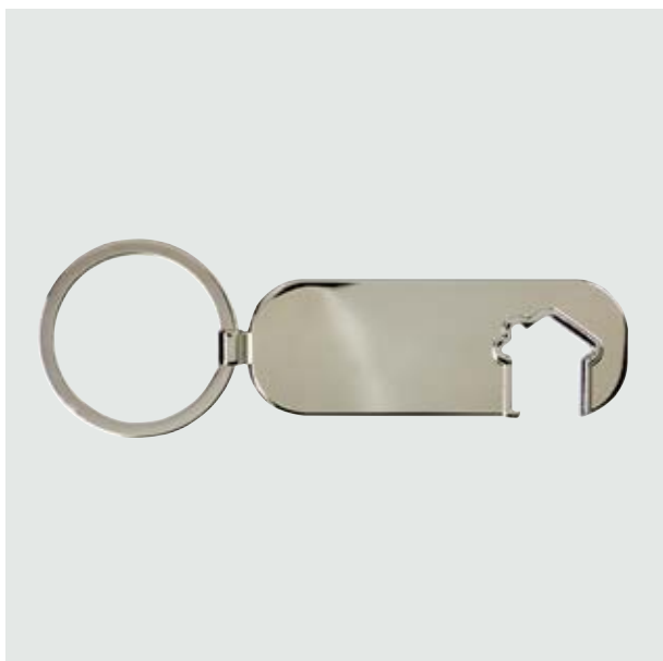
LLA 28 Llaverero Ranura-Casa