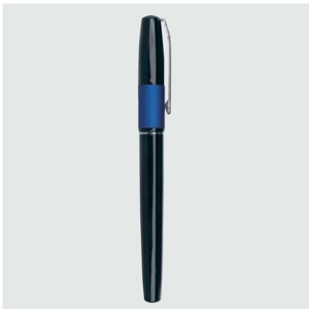
BOL 555 Bolígrafo Khalos