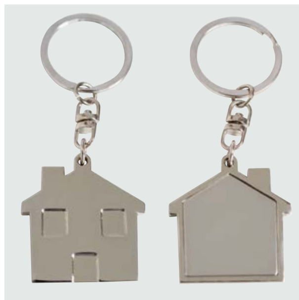
LLA 29 Llaverero Forma Casa