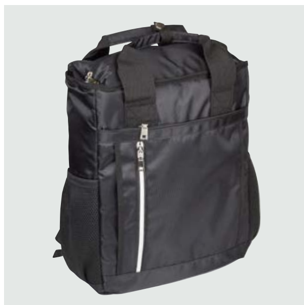
MAL 113 Lonchera Hamilton