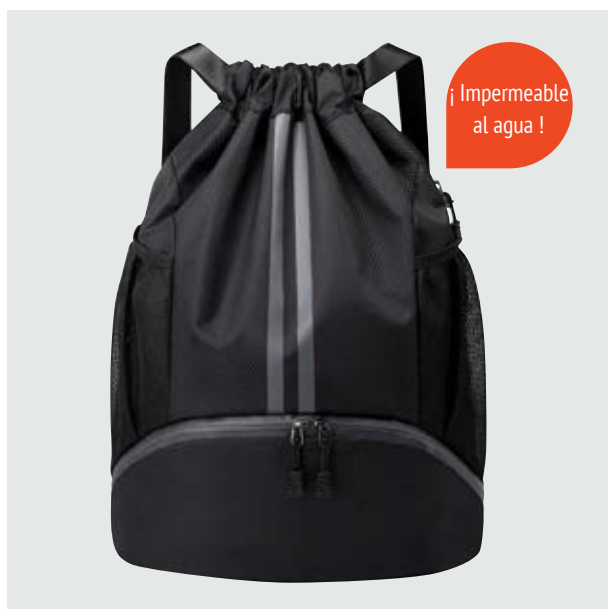
MAL 205 Backpack Durant ■