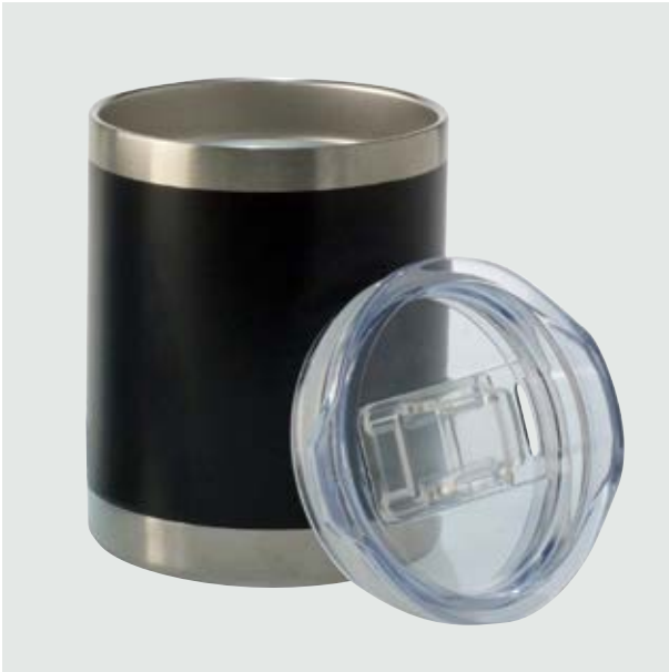
TH 202 Tarro Encino