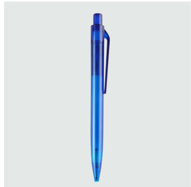
BOL 301 Bolígrafo Tiziano