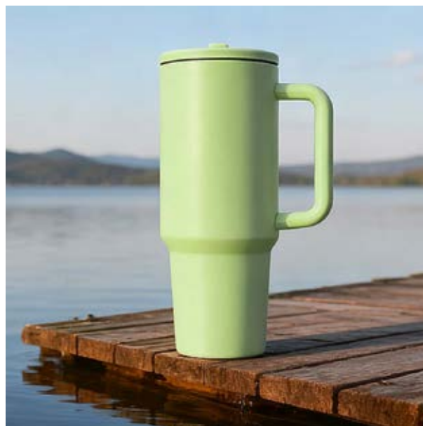
TH 31 Termo Flox