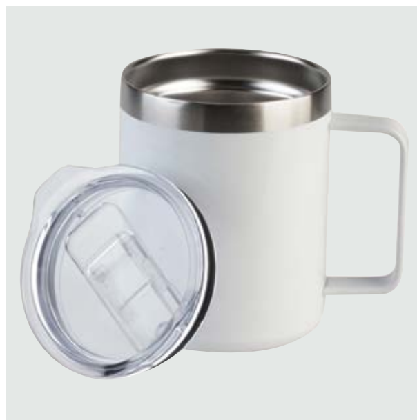
TH 218 Taza Maple