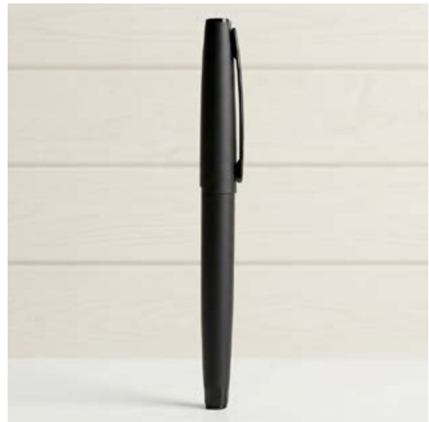
BOL 573 Bolígrafo Top Black