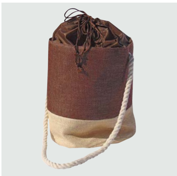
MAL 01 Bolso Cool ■ ■ ■ ■ ■

Material: Raffia Medida: 30 x 25.5 cm diameter.