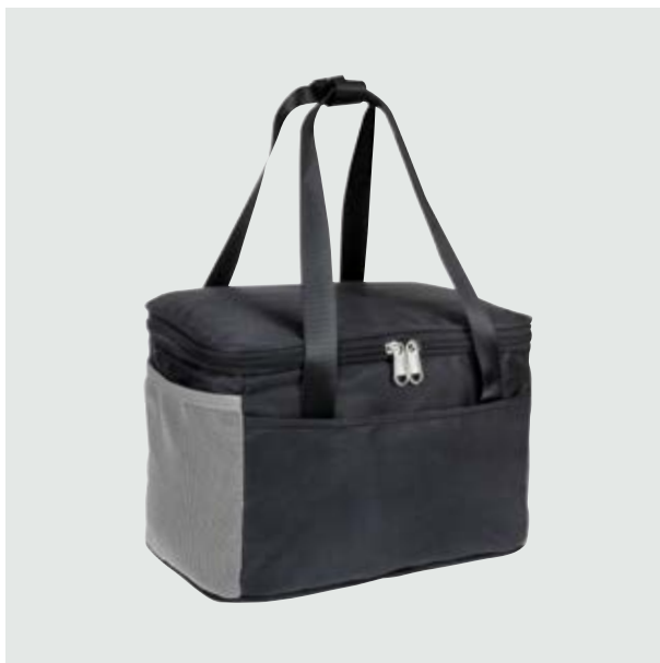
MAL 115 Lonchera Luca