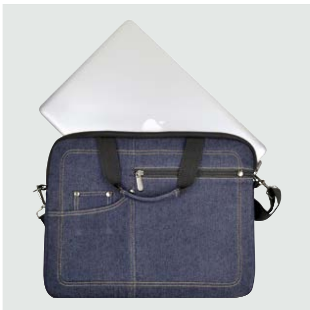
MAL 308 Porta-documentos Bolt