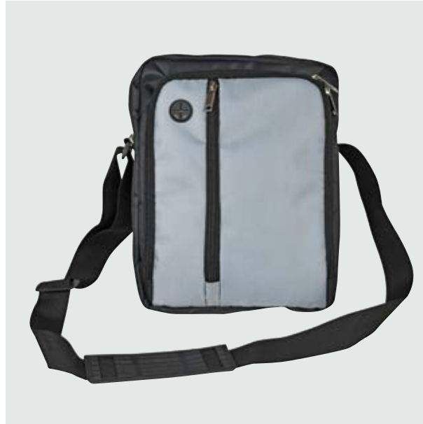
MAL 528 Bandolera Baggio ■