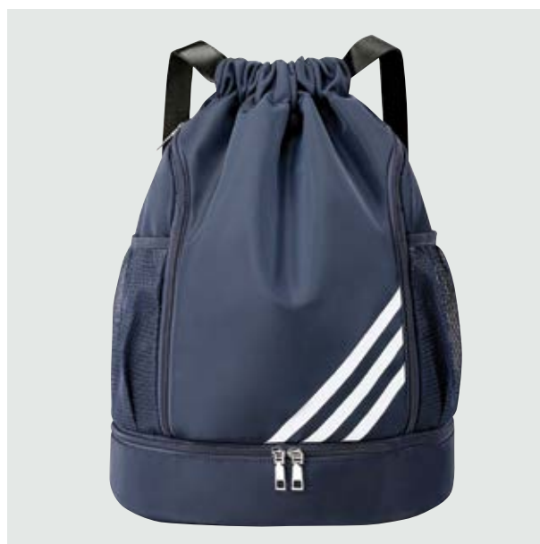
MAL 206 Backpack Bikila ■ ■