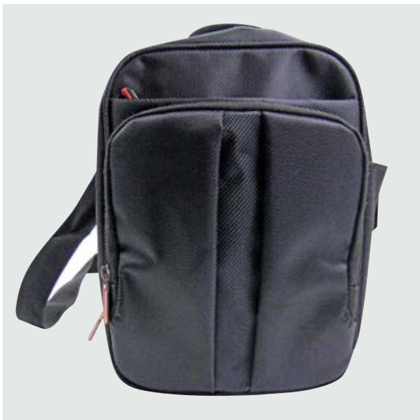
MAL 521 Bandolera Borg ■