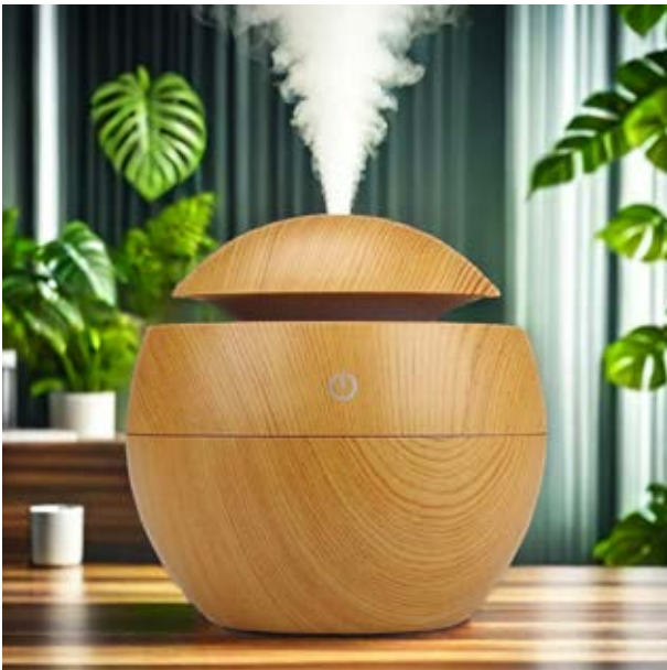
CAS 00 Vaporizador Redondo