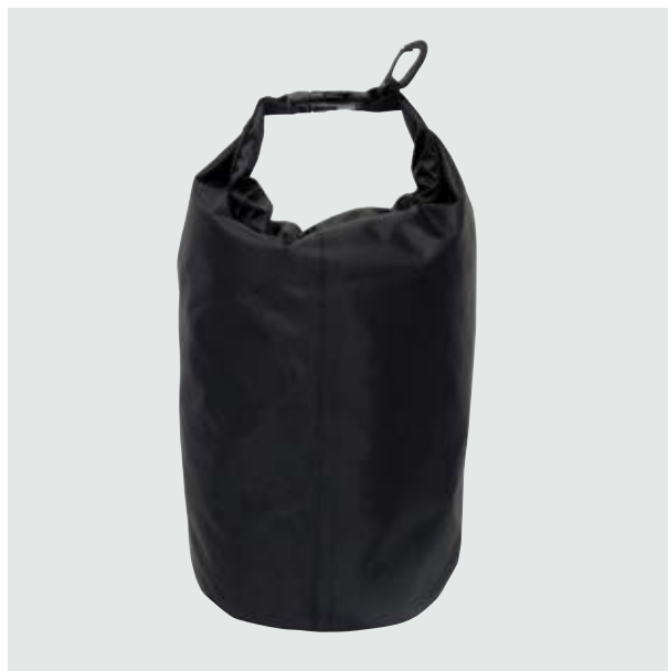
MAL 102 Dry-Bag Armstrong

Material: Polyester Medida: 35 x 27.5 cm