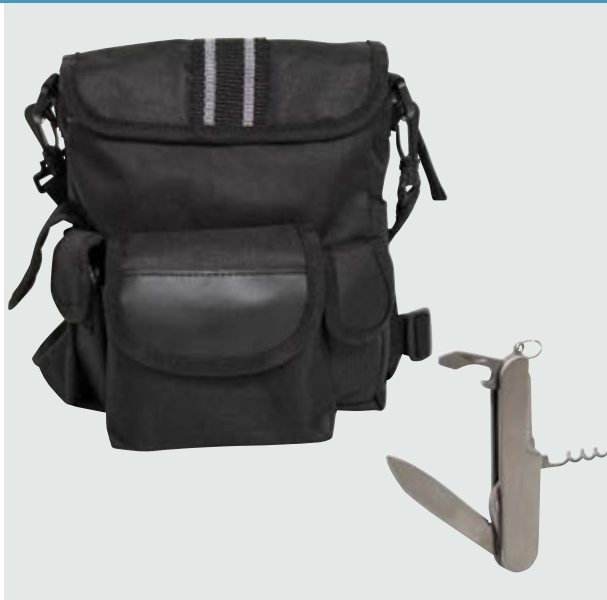
HER 40 Mochila Scout ■