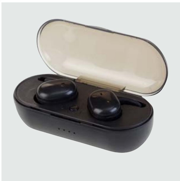
TEC 03 Audífonos Franklin ■