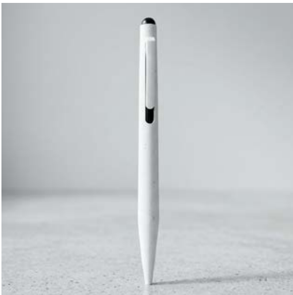
BOL 330 Bolígrafo Gibrán