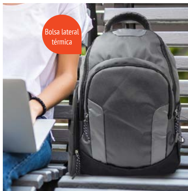
MAL 616 Backpack Sampras