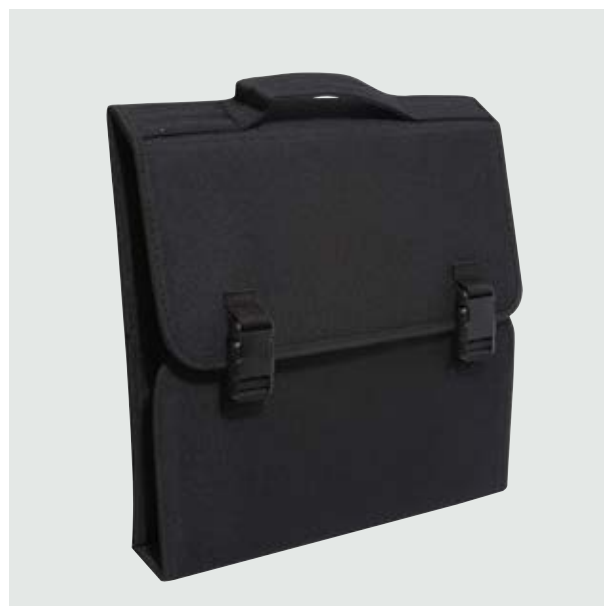
BOE 00 Estuche para Bolígrafos