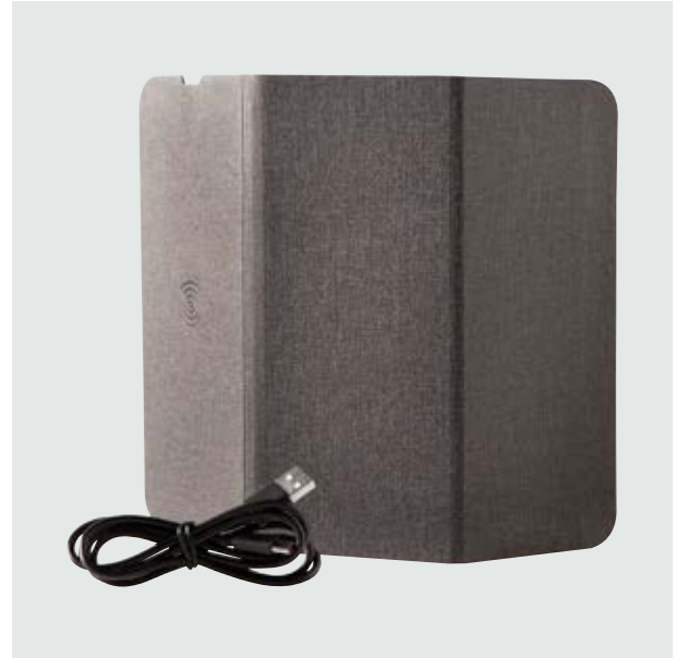
TEC 102 Mousepad Planck