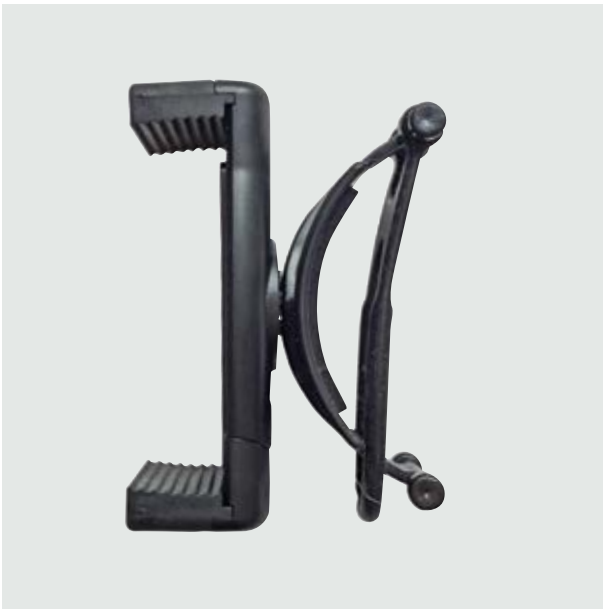
TEC 15 Pascal Holder ■