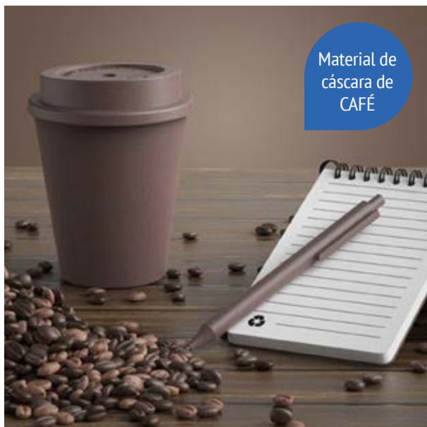
TH 214 Set Coffee Husk