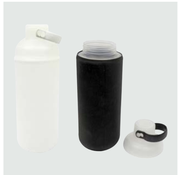
TH 115 Cilindro Soja