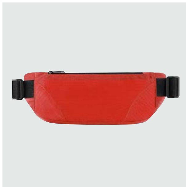
MAL 220 Cangurera Rodman