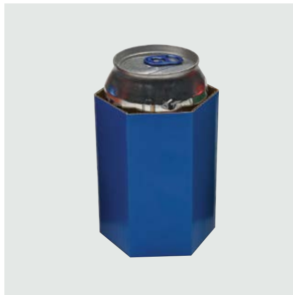
TH 306 Card Can-Holder