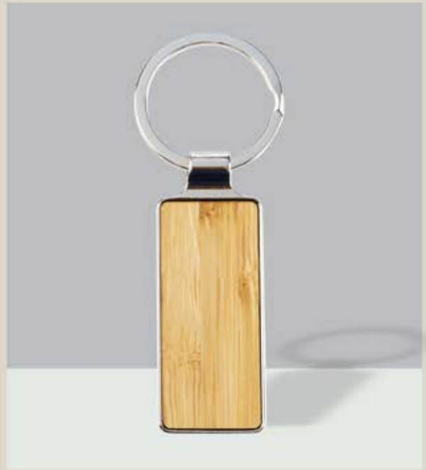
LLA 45 Llaverito Rectangular Bamboo

Material: Metal con aplicación de lámina de bamboo Medida: 8 x 4 cm diámetro