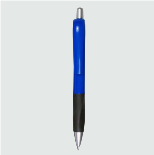
BOL 06 Bolígrafo Fiori