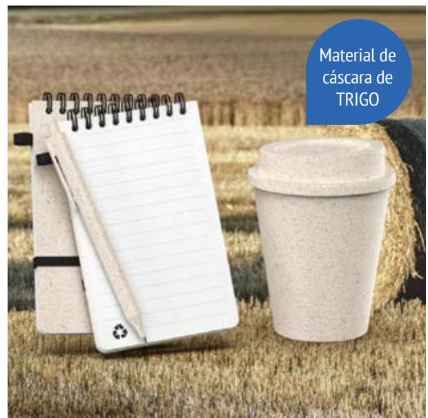
TH 215 Set Trigal