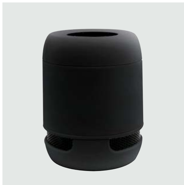
TEC 45 Bocina Marconi