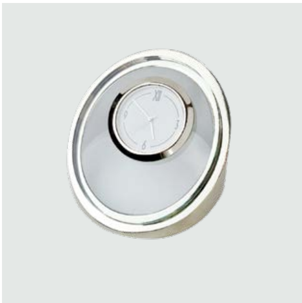
REJ 03 Reloj Tikal