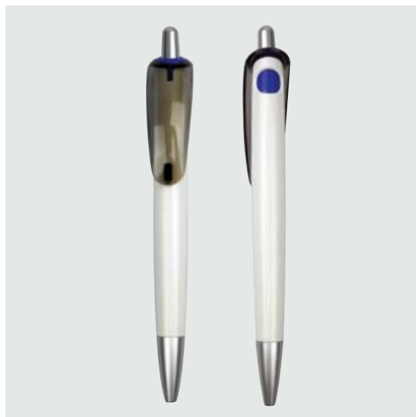
BOL 03 Bolígrafo Warhol