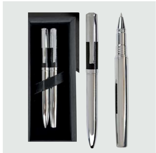
BOL 502 Set Bolígrafos Klee