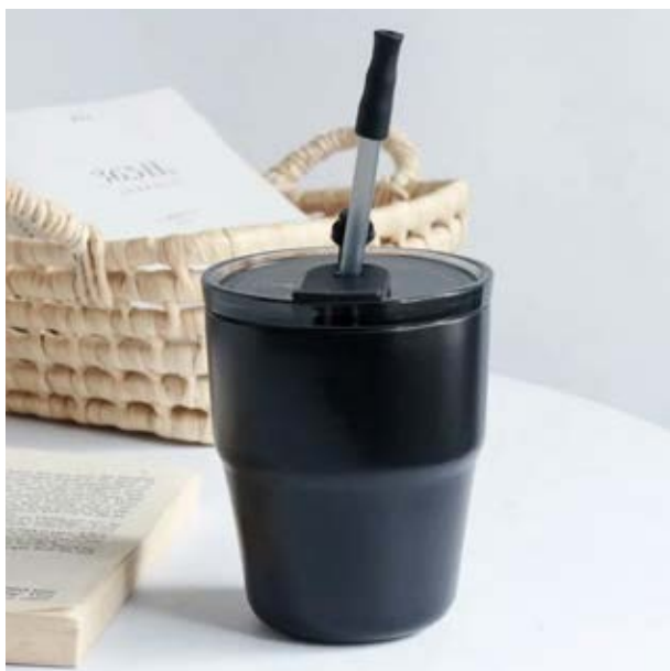
TH 02 Termo Potus