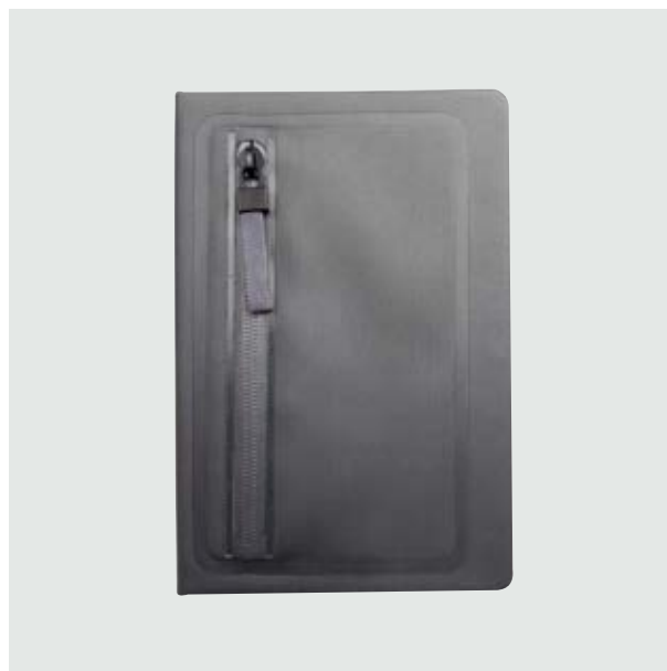
ESC 536 Libreta Denver