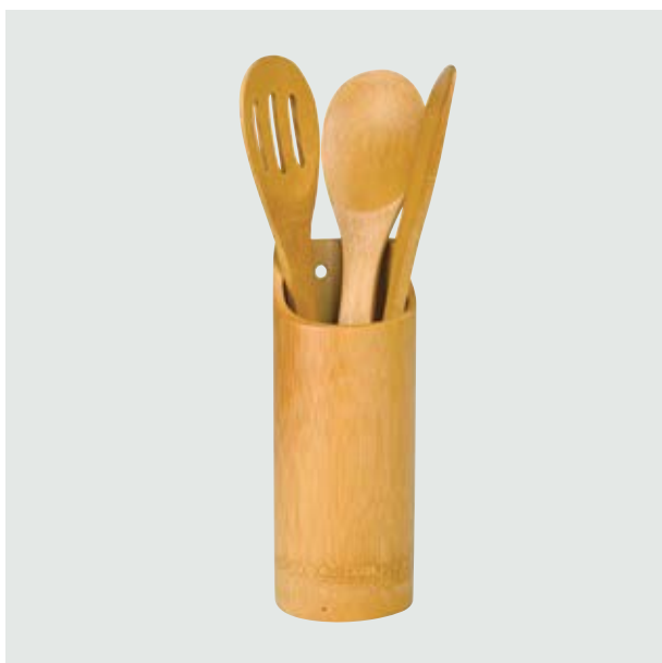
CAS 58 Spoon Set