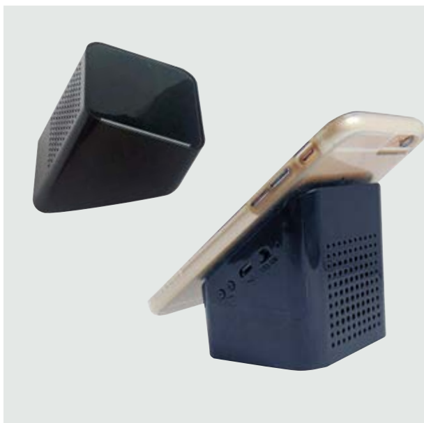
TEC 42 Bocina Dunlop