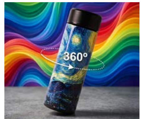
Full Color 360°

Consiste en transferir una pasta espesa de tinta a través de una malla tensada en un marco de madera o metálico. Esta técnica funciona solamente sobre superficies planas.