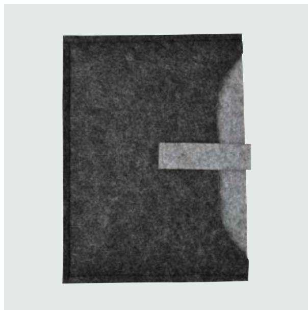
TEC 773 Mini Porta iPad Dalton