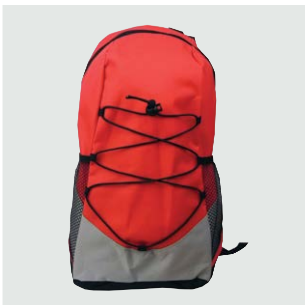
MAL 215 Backpack Neymar