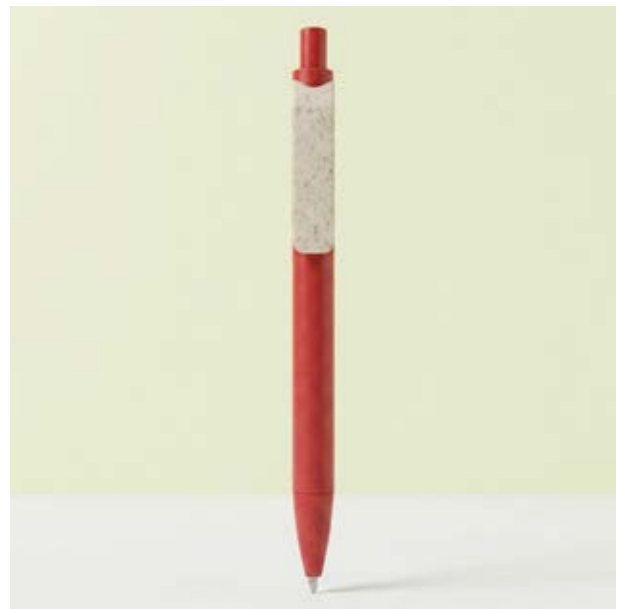
BOL 334 Bolígrafo Quinn