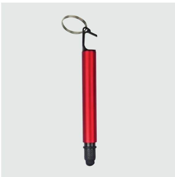
BOL 239 Bolígrafo Turrell