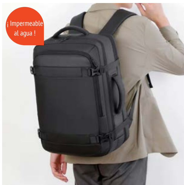
MAL 614 Backpack Ledecky