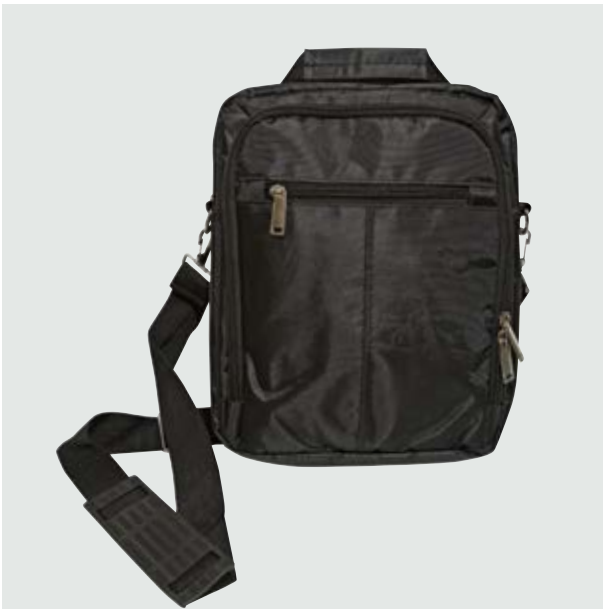
MAL 529 Bandolera Agasi