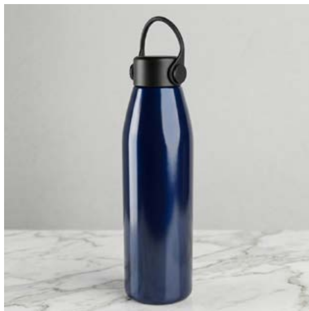
TH 05 Termo Arce