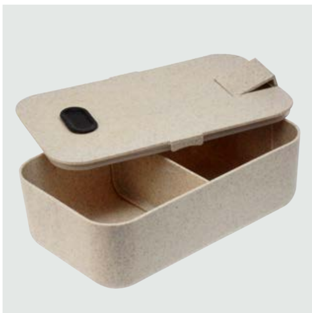
CAS 40 Lunch Box Taurus ■