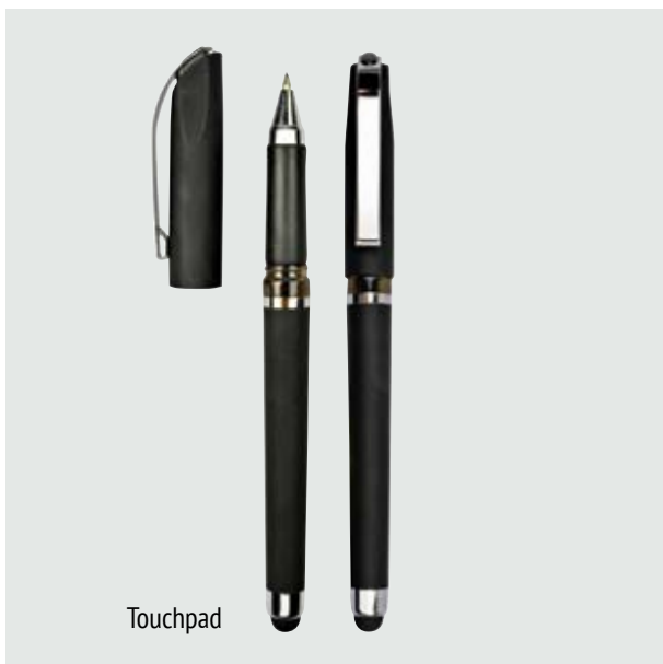
BOL 516 Bolígrafo Bosco