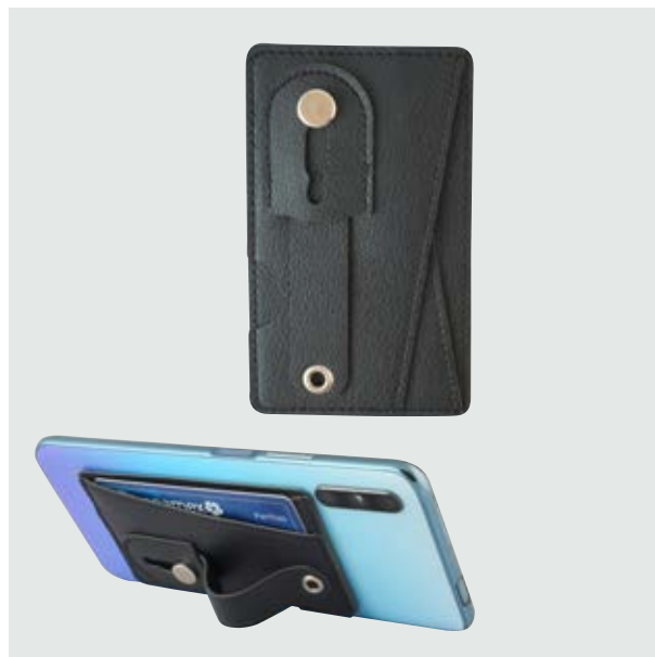
TEC 244 Tarjetero Hook

Material: Plástico y Silicón Medida: 6.2 cm diámetro