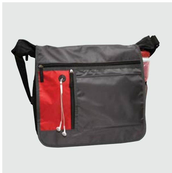
MAL 309 Maletín Alfa