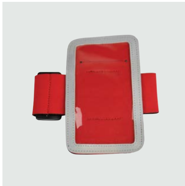
DEP 50 Athletic Band ■ ■ ■ ■