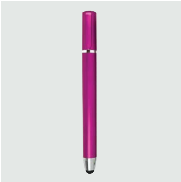
BOL 246 Bolígrafo Tuché