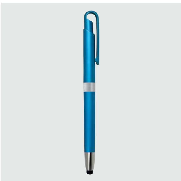
BOL 222 Bolígrafo Jasper