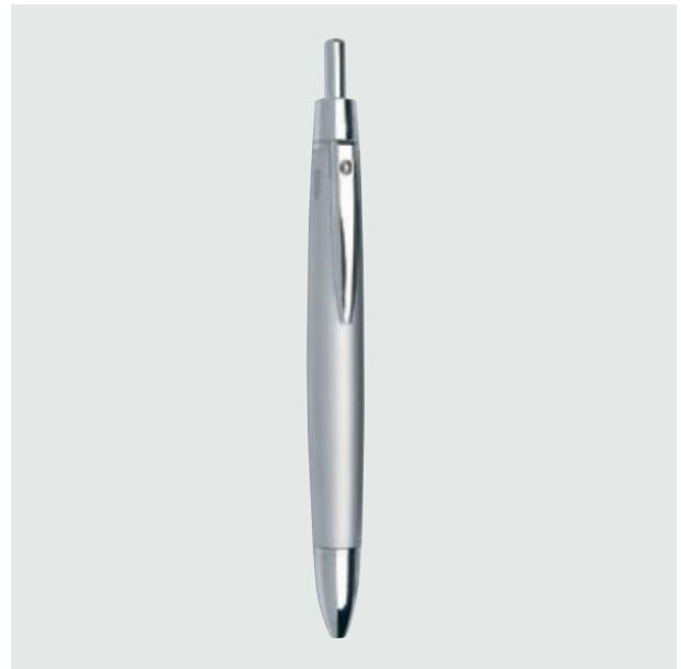
BOL 560 3-1 Bolígrafo Chrome Pen