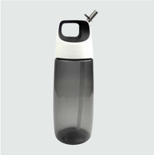
TH 106 Cilindro Agave