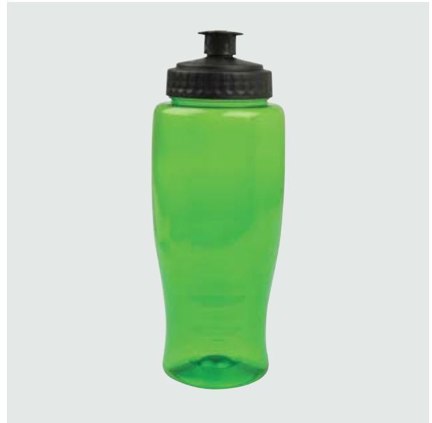
TH 102 Cilindro Cica Traslúcido