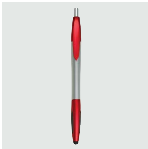
BOL 221 Bolígrafo Kapor

Material: Plástico Medida: 14.3 x 0.8 cm.