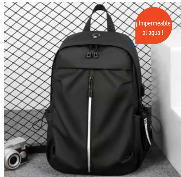
MAL 607 Backpack Kato