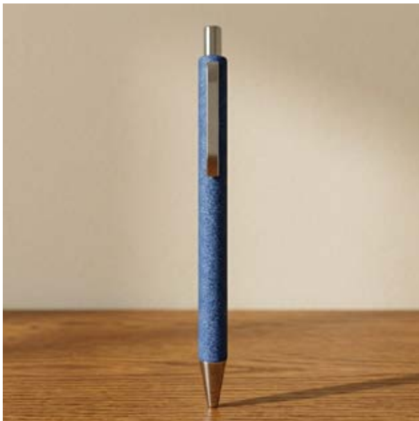
BOL 556 Bolígrafo Rodin