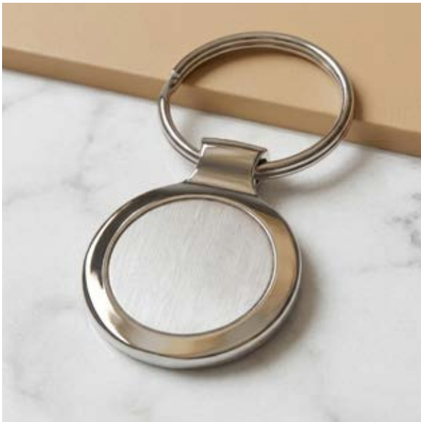
LLA 21 Llavero Redondo Sencillo Plano