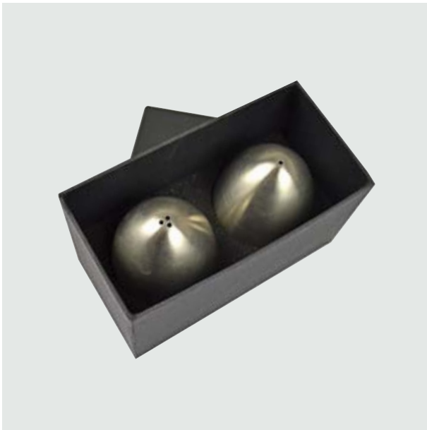
CAS 20 Set Pepper