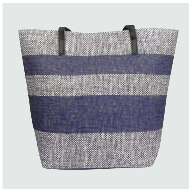
MAL 04 Bolsa Desire ■ ■ ■ ■ ■