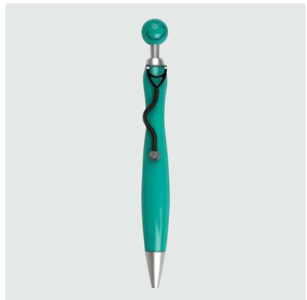
BOL 02 Bolígrafo Doctors