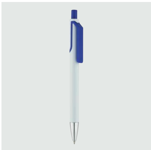
BOL 20 Bolígrafo Cuevas