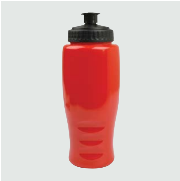
TH 101 Cilindro Cica Sólido