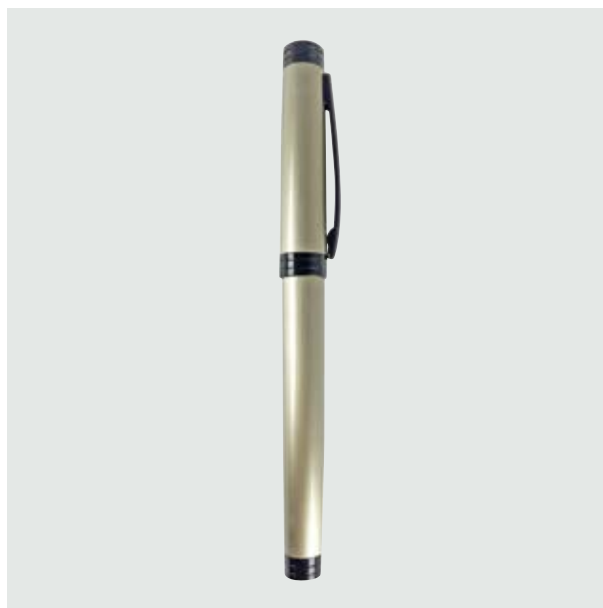
BOL 528 Bolígrafo Zener