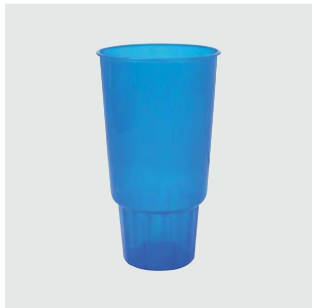
TH 209 Vaso Promocional