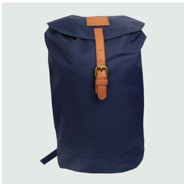
MAL 213 Backpack Powell