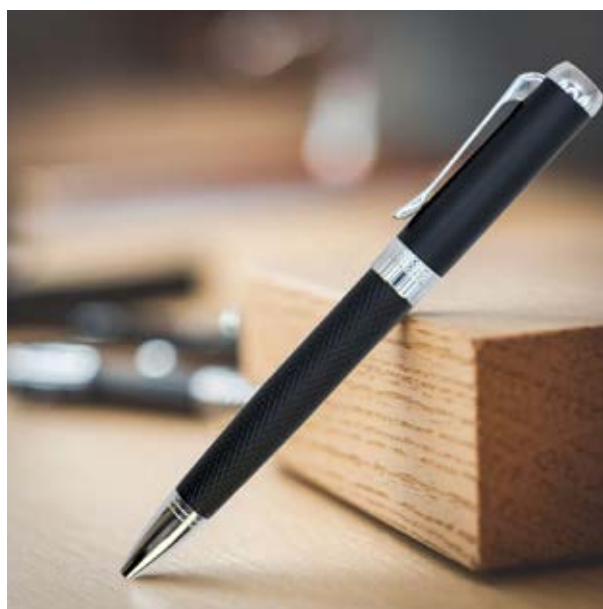
BOL 524 Bolígrafo Lautrec