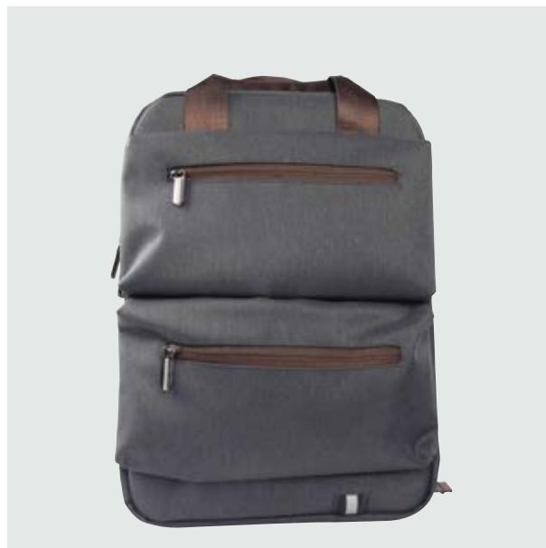
MAL 619 Backpack Roger ■