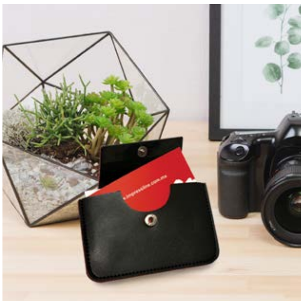
ESC 852 Tarjetero Praga