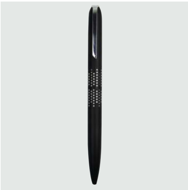
BOL 551 Bolígrafo Vincent