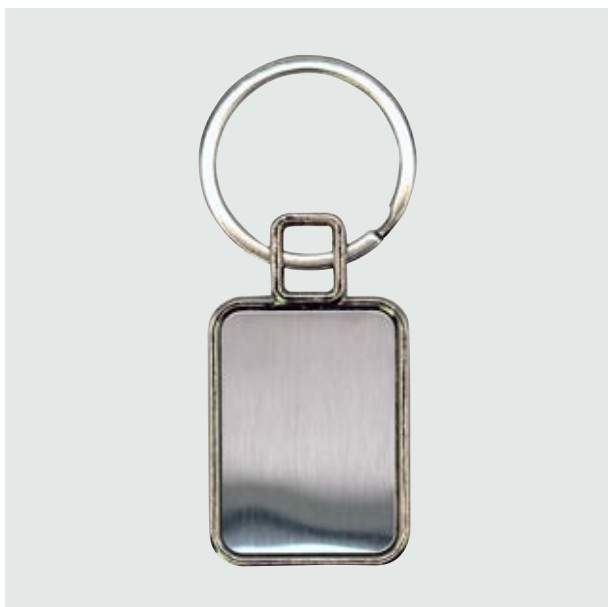
LLA 23 Llavero Cuadrado Plano