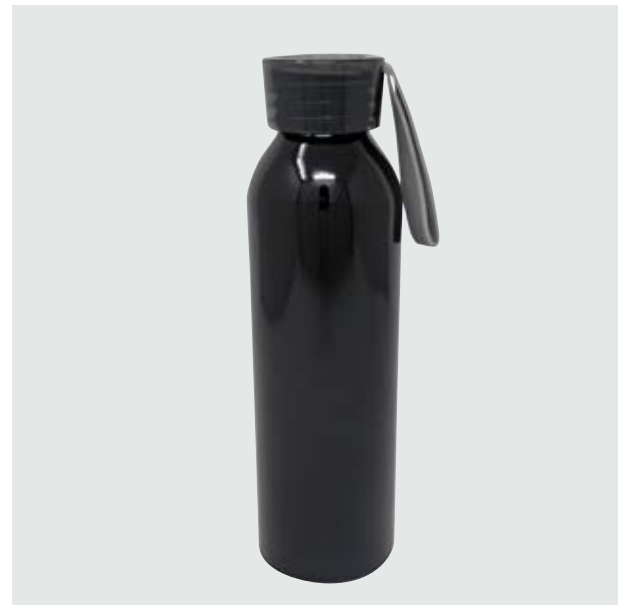
TH 111 Termo Ródano