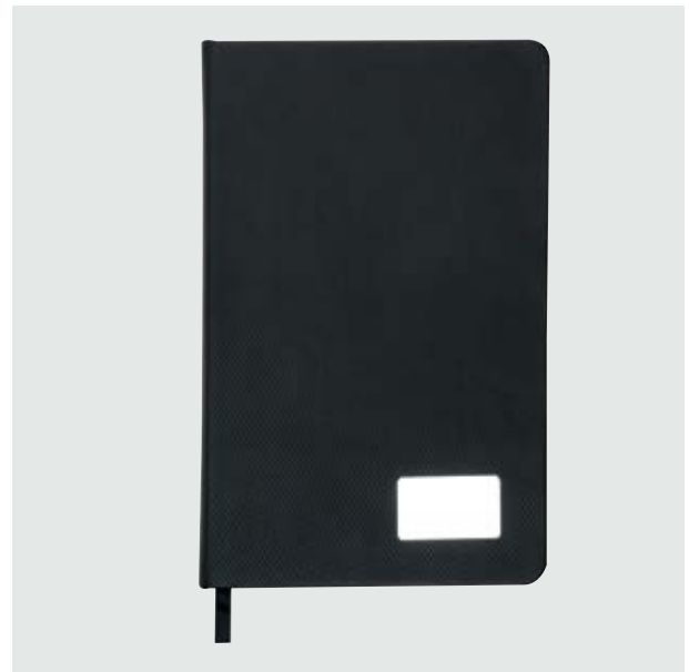
ESC 528 Libreta Quebec