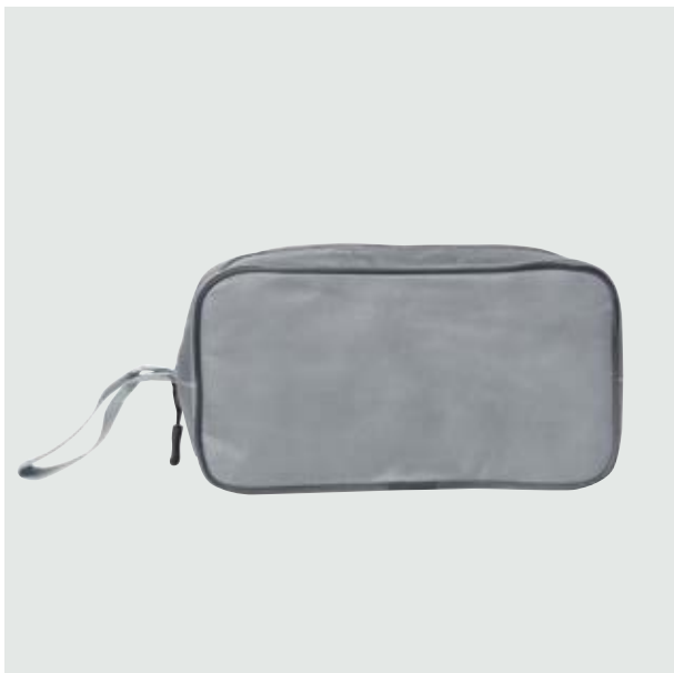
FOR 04 Neceser para Viajes Tíber ■