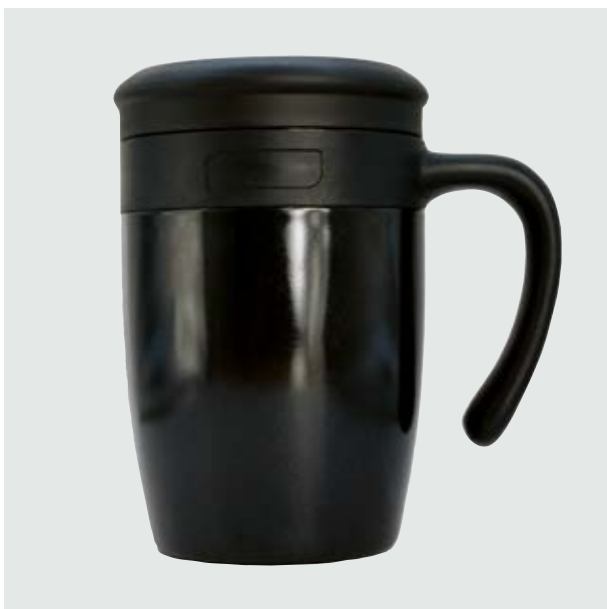
TH 223 Taza Malva