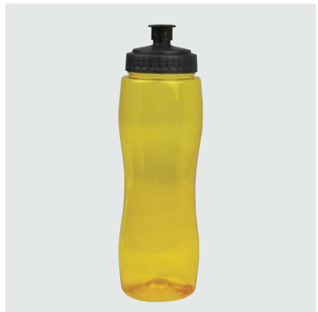
TH 105 Cilindro Ebano Traslúcido