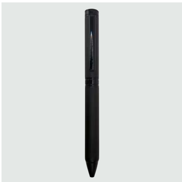
BOL 526 Bolígrafo Carrington