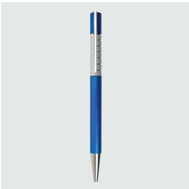
BOL 145 Bolígrafo Alfaro