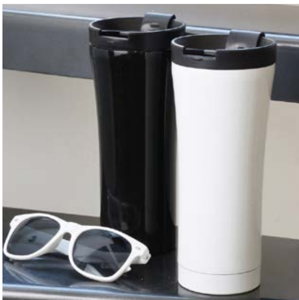
TH 04 Termo Koa