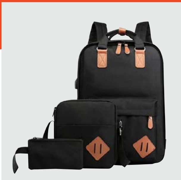
MAL 609 Set maletines Gordon ■