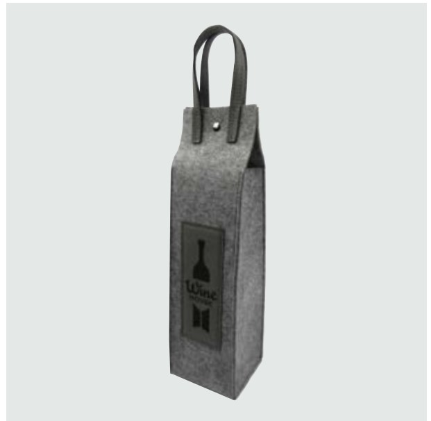
CAS 35 Portavinos Babe