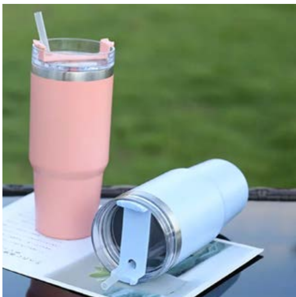
TH 27 Termo Menta