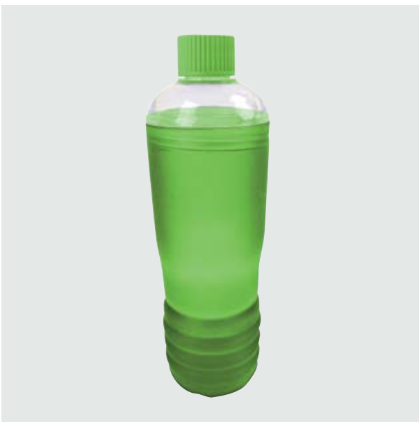
TH 114 Cilindro Kiwi