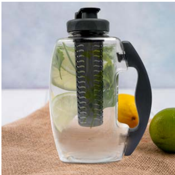
TH 50 Anfora Lilo