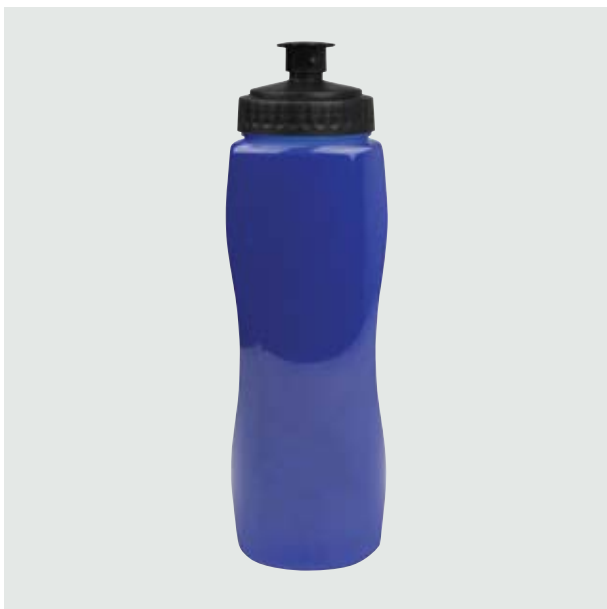
TH 104 Cilindro Ebano Sólido