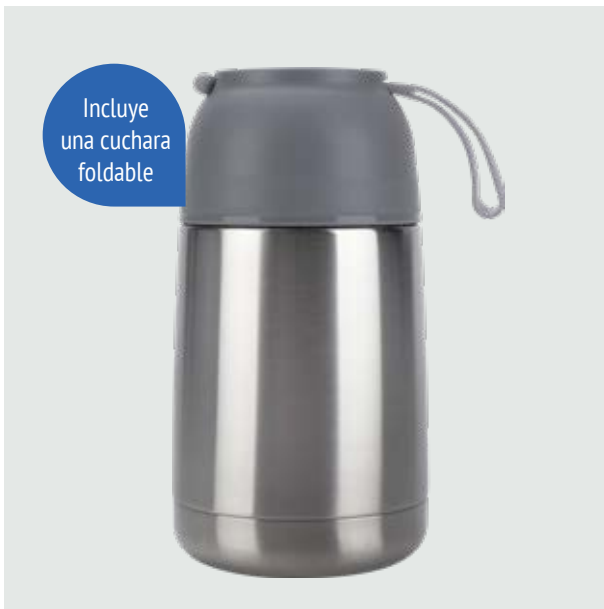
TH 30 Termo Batata