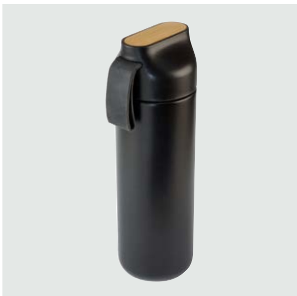
TH 12 Termo Roble

Material: Acero inoxidable Medida: 23 x 7 cm diámetro