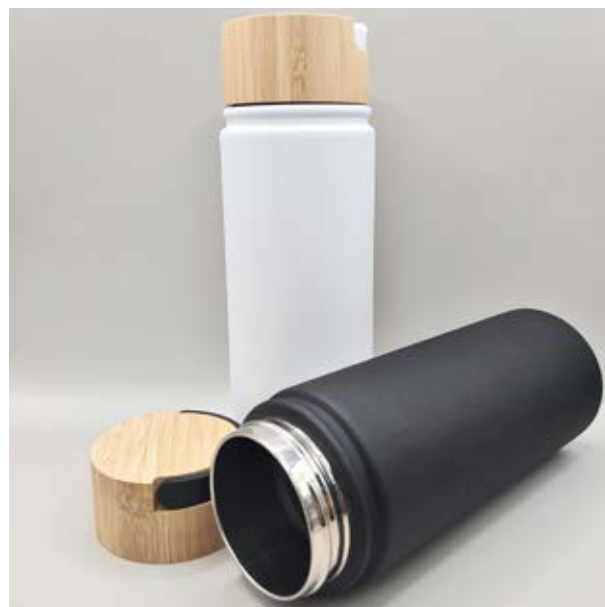
TH 13 Termo Ambar

Material: Acero inoxidable Medida: 19.5 x 7.4 cm diámetro