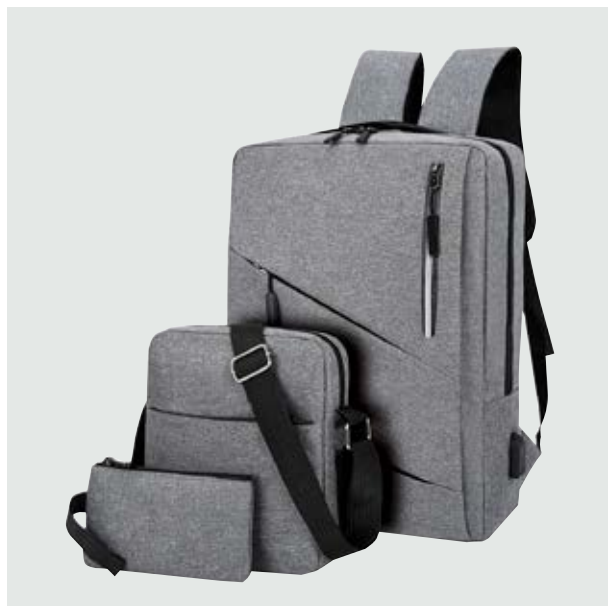
MAL 618 Set maletines Nikola ■