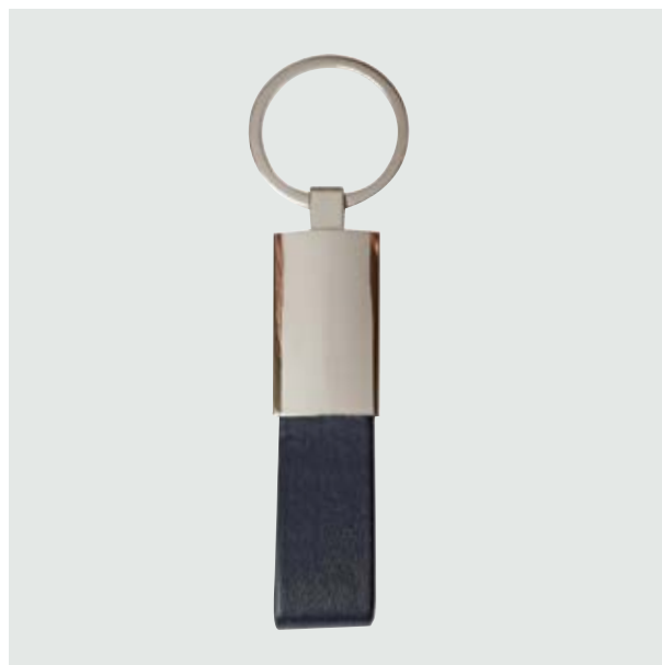
LLA 35 Llavero Rectangular Curpiel