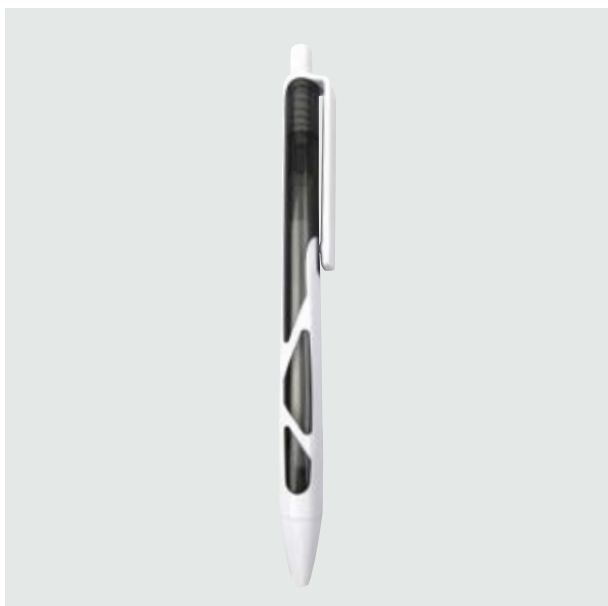
BOL 00 Bolígrafo Hooper