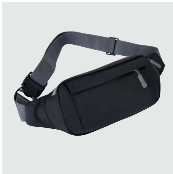
MAL 223 Cangurera O'Neal