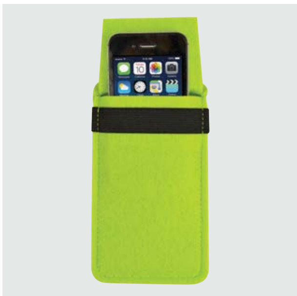
TEC 27 Phone-Case Volta