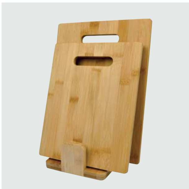
CAS 53 Bamboo Cutting Set