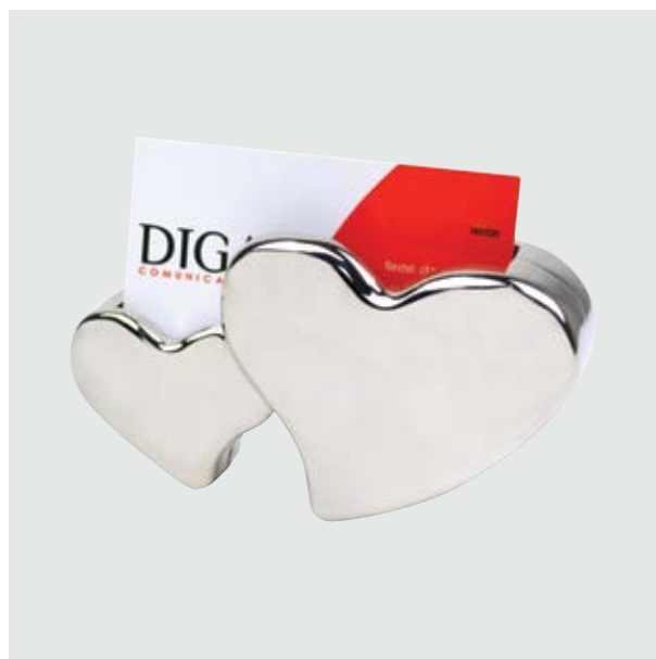
ESC 865 Porta Tarjetero Twin Heart