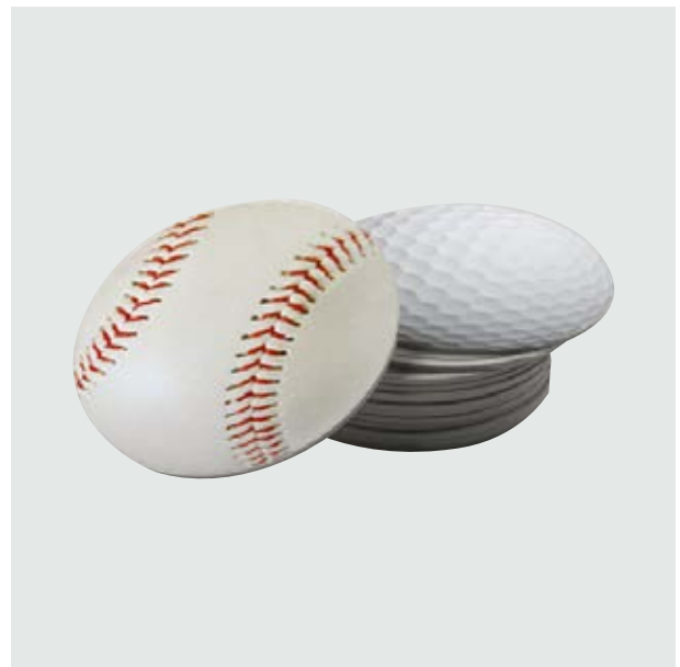
DEP 04 Coasters Deportivos

Material: Cartón Medida: 10 cm de diámetro