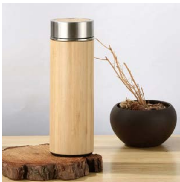
TH 19 Termo Bamboo ■

Material: Acero inoxidable. Aplicación exterior en lámina de bambú.