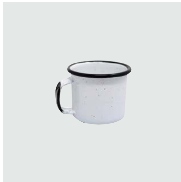
TH 212 Shot-Tequilero