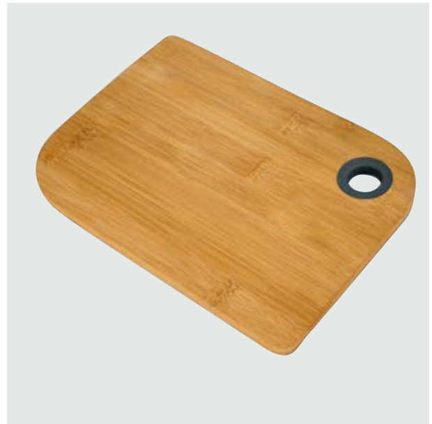
CAS 51 Tabla para picar Columba