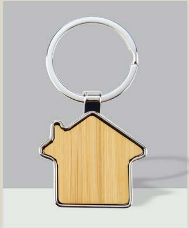
LLA 46 Llaverito Casa Bamboo