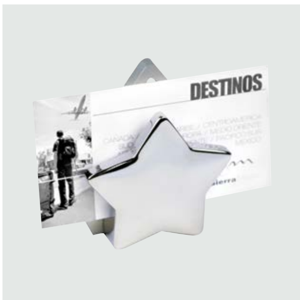
ESC 864 Porta Tarjetero Lyra