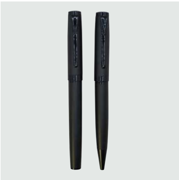
BOL 501 Set Bolígrafos Basquiat