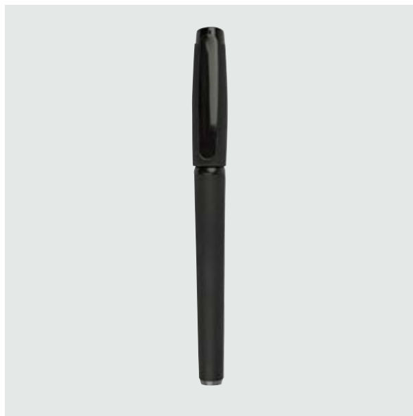
BOL 557 Bolígrafo Renoir