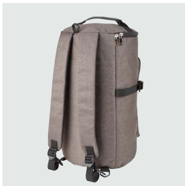
MAL 610 Backpack Harden ■