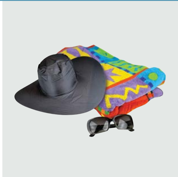
FOR 11 Sombrero Mágico ■